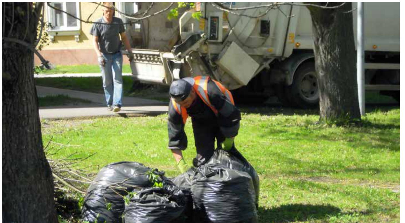
Вывоз садовых отходов и мешков со старыми листьями в Кристийне

Весна перевалила за свой экватор, и я хочу поздравить вас с наступающим праздником весны 1 мая, пожелать, чтобы солнечных дней впереди было как можно больше, и напомнить, что уже в мае стартует сезон организуемых Управой Кристийне мероприятий под открытым небом. Подробное расписание этих мероприятий мы разошлем всем жителям по почте; но если вы до конца мая не получите нашу брошюру, сообщите нам об этом по телефону или электронной почте, а лучше приходите за экземпляром к нам в здание Управы района (ул. Тулика, 33b). Здесь всегда рады вас видеть!