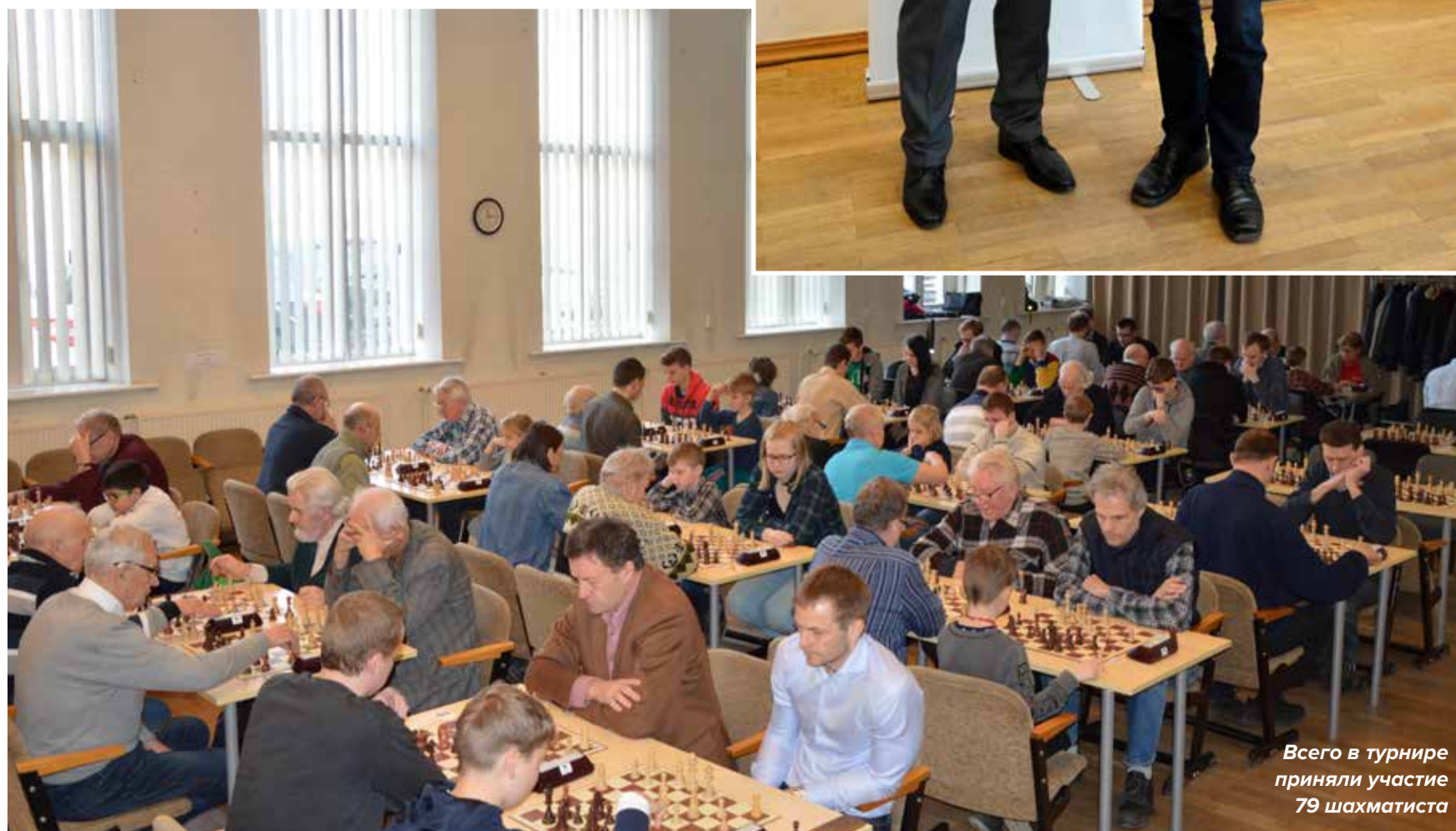
Всего в турнире приняли участие 79 шахматиста