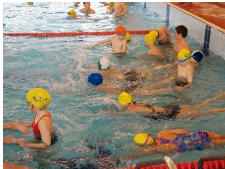
Дети в бассейне

И еще кое-что. Тест, описанный во вступлении к данной статье, рекомендую попробовать выполнить и взрослым. Если не справитесь, следует серьезно задуматься. В Эстонии каждый человек должен уметь плавать – мы ведь морская держава и страна с более чем тысячей внутренних водоемов.