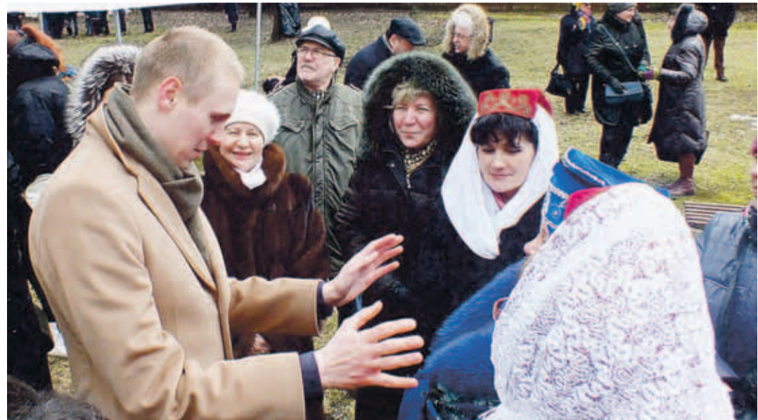
Раймонд Кальюлайд встречается с жителями Пыхья-Таллинна. ■