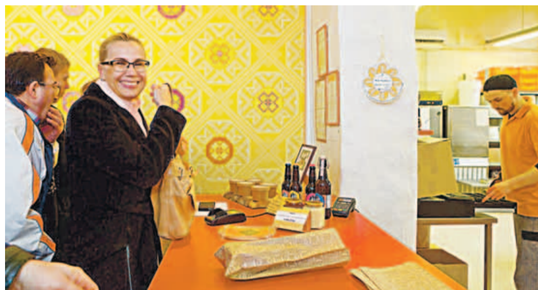
В ходе своего визита министр экономики ознакомилась с работой пекарни Muhu Pagarid.

“Пыхья-Таллинн – это очень быстро развивающийся район, очень контрастный, но предлагающий много возможностей. Приятно видеть, с каким умением в этой части города удалось использовать некоторые давно опустевшие старые здания и тем самым вдохнуть в них новую жизнь. Большую роль в развитии Пыхья-Таллинна играет сотрудничество между район-