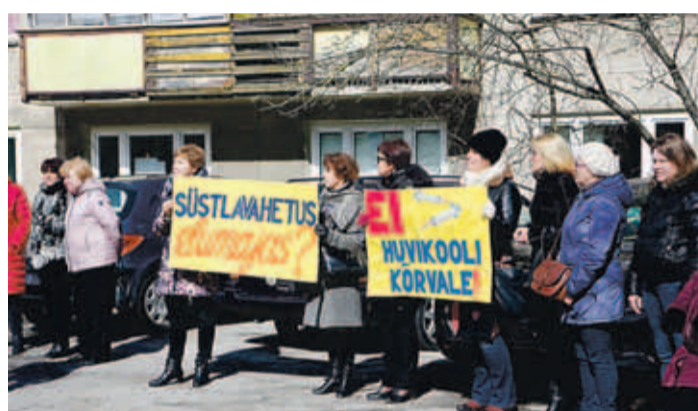
Организованный квартирным товариществом пикет собрал около 150 человек.