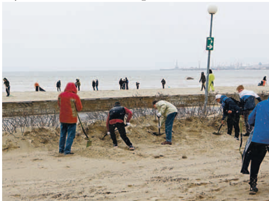
В ходе субботника на Штротке было собрано 15 тонн прошлогодних листьев и мусора.