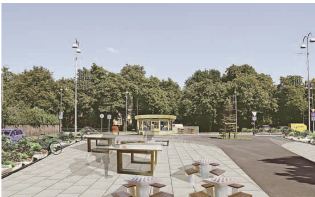
В ходе обсуждения из четырех эскизов площади был выбран вариант "Для всех".

Для того чтобы жители Пельгулинна смогли выразить свое мнение, управа района провела две встречи с местными жителями, а также выставляла эскизы на странице