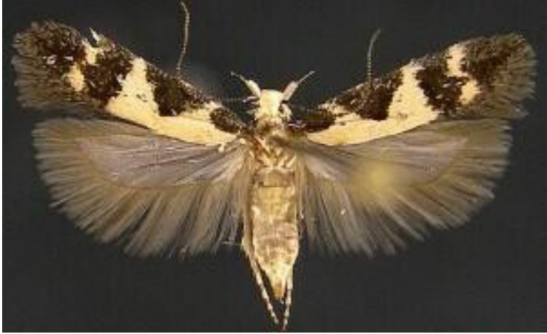
KOILIBLIKAS- TOITUB VAHTRALEHTEDEST