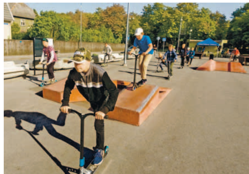
Парковочная площадка превратилась в главную площадь микрорайона Пельгулинн. Александр Гужов

Скамейки и клумбы играют роль ограды, которая повышает безопасность катающихся на рулях и самокатах детей и молодых людей. В будущем году планируется продолжить обновление площади – построить игровую площадку и частично заменить асфальт декоративной плиткой. ■