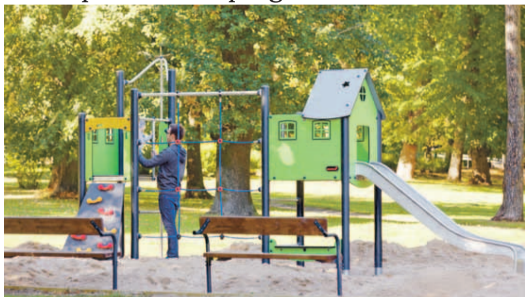
Kopli kalmistupargi mänguväljak uuenes. Aleksandr Gužov

Mänguplatsi kordategemine viibis mõnevõrra, kuid nüüd on see valmis. Kopli kalmistupargi uuendamistööde käigus paigaldati ka mitmed uued pingid ja prügikastid, uuendati pargiteed ja selle juurde kuuluvad trepid, parandati piirdeaed, paigaldati infostendid ning tehti korda purskkaev. Tööd läksid maksma ligikaudu 90 tuhat eurot. ■