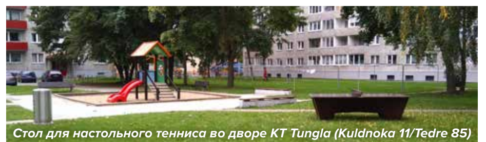
Стол для настольного тенниса во дворе КТ Tungla (Кульднокка 11/Тедре 85)

Скамейки были посвящены достойным людям или замечательным группам людей по интересам. Теперь вы можете с комфортом посидеть, дав отдых ногам и спине. Новые скамейки установлены: на улице Котка, во внутреннем дворе многоквартирных домов по улице Сэби, во внутреннем дворе улиц Вялья и Сыстра, во внутреннем дворе многоквартирных домов по улице Кульднока, на пересечении улиц Маазика и Ваарика, в парке Тондимыйза, а после завершения ремонта бульвара Лагле скамейка