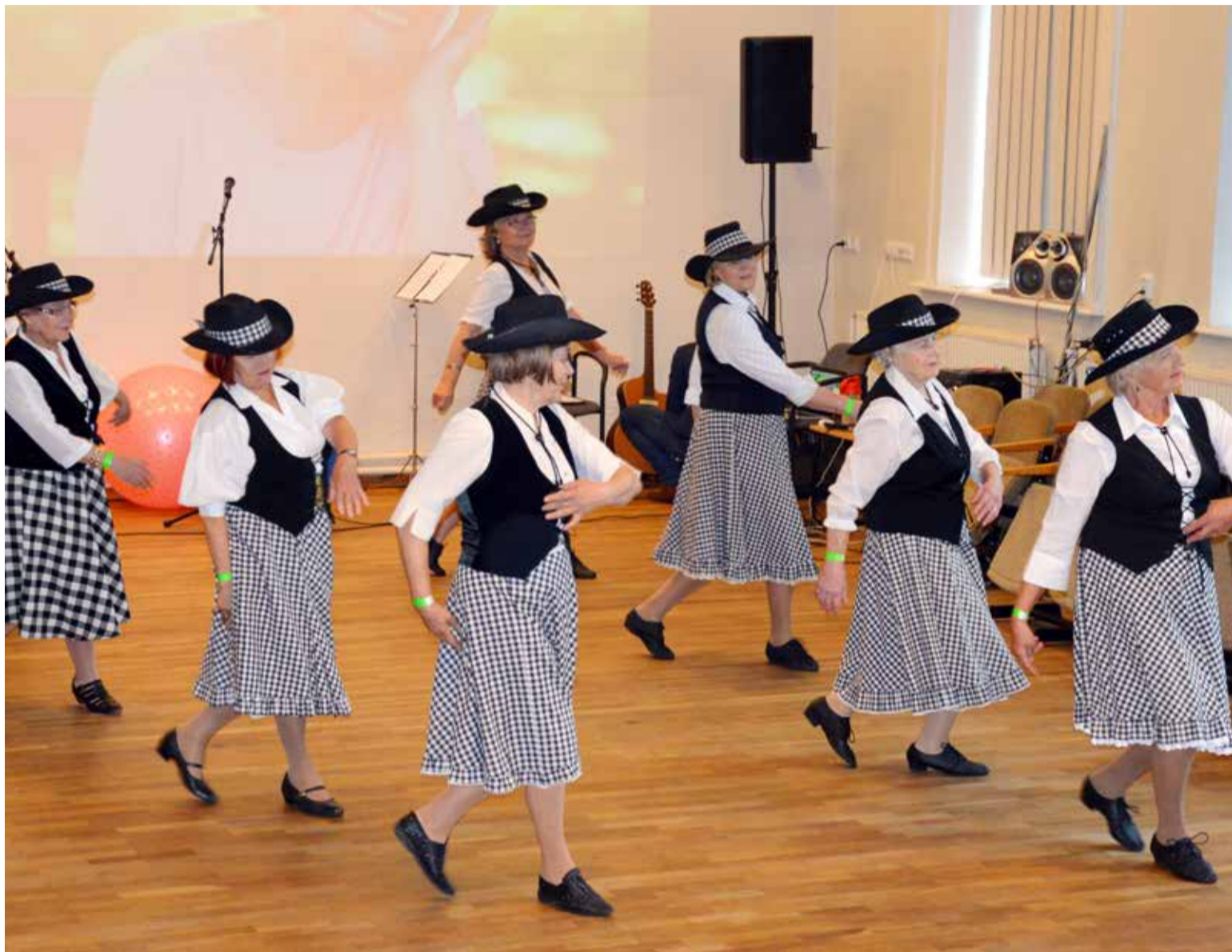
На Дне здоровья выступала группа по line-танцу «Lustiline»