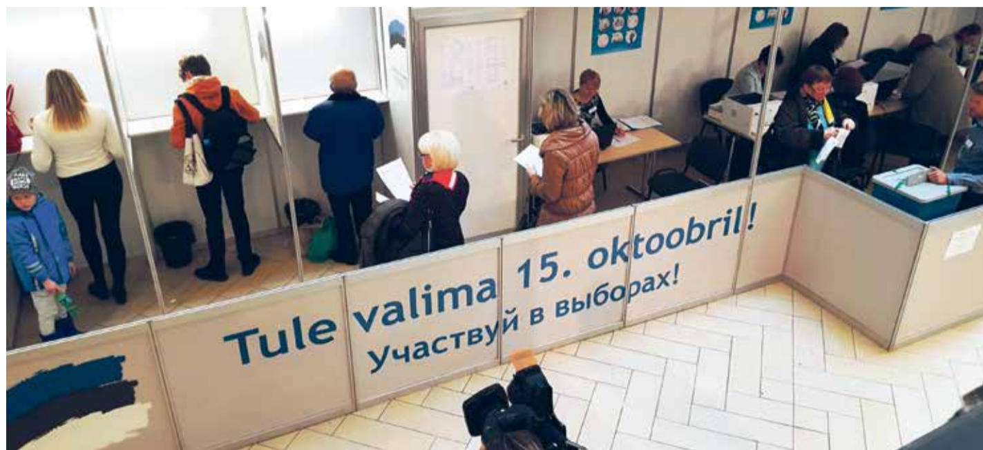
В день открытия предварительного голосования 5 октября на избирательном участке в центре Solaris было полно народу.