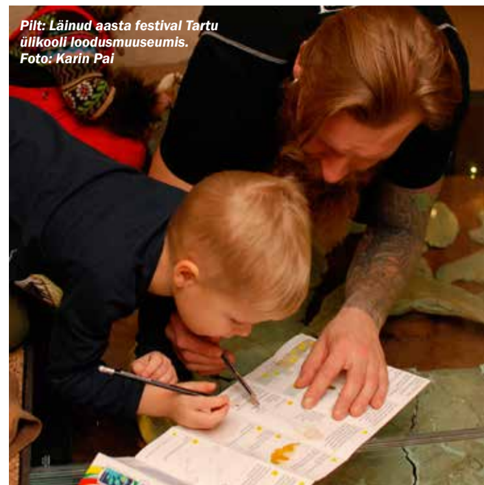
Pilt: Läänud aasta festivali Tartu ülikooli loodusemuuseumis.

Festivali eel, ajal ja järel korraldatakse mängu ja loosimisi, mille kohta