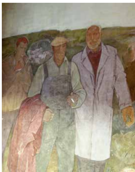
Säilinud fragmente Dolores Hoffmanni seinamaalist endises kinos Rahu.