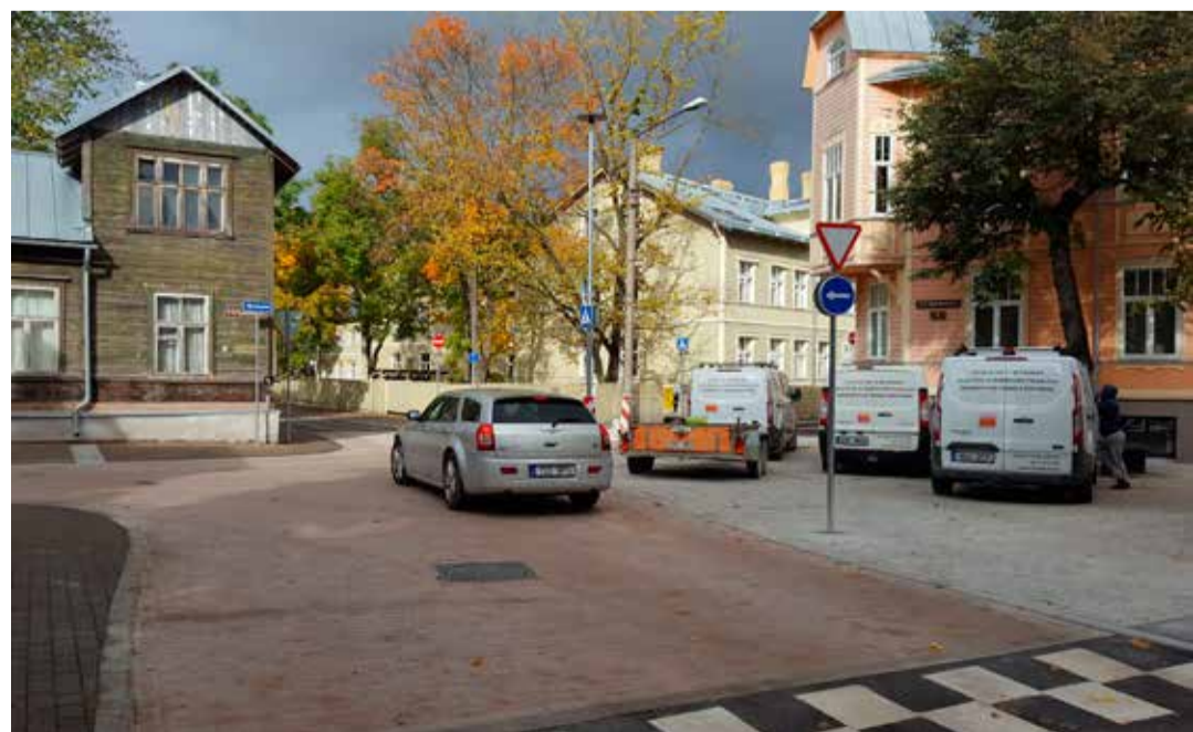
Vast remonditud Vesivärava tänav annab aimu, kui õdusana hakkab kord välja nägema kogu Kadrioru piirkond.

Igal aastal pöördub keskuse poole üha rohkem peresid. Eelmisel aastal sai psühholoogilist abi 5060 inimest, erinevaid sotsiaalteenuseid kasutas 483 perekonda.