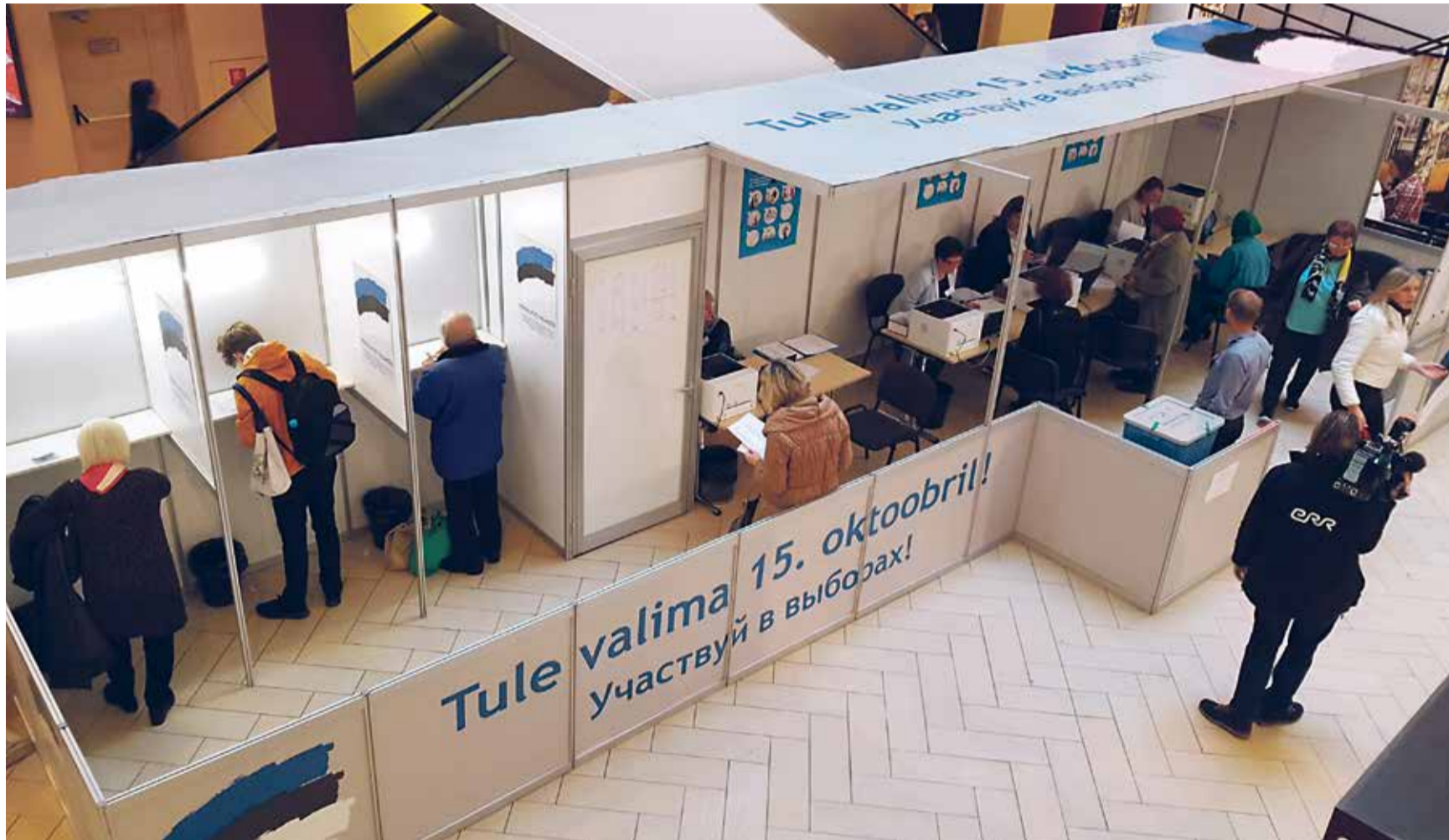
Eelhääletamise avapäev 5. oktoober oli Solarise keskuse valimisjaoskonnas rahvarohke.