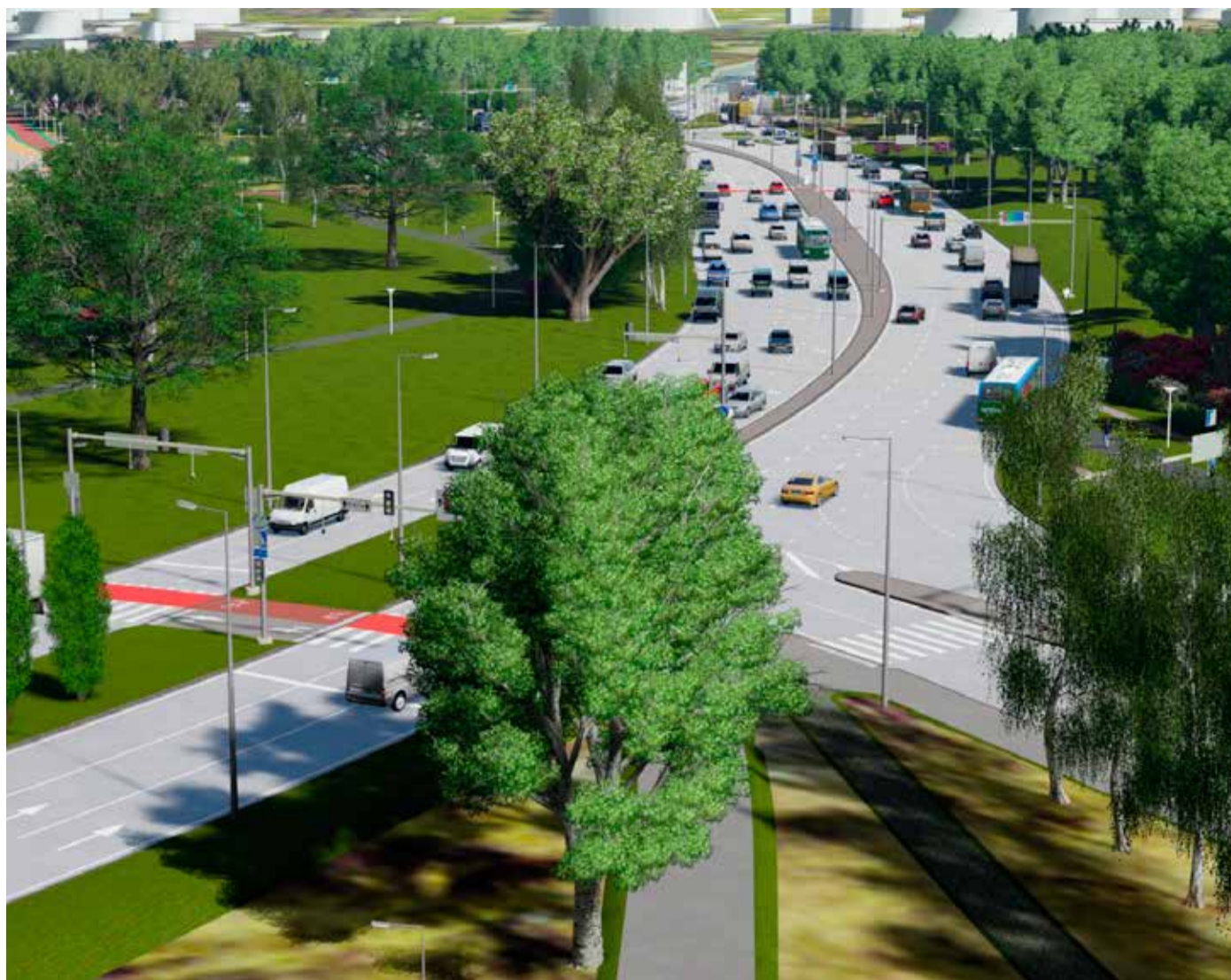
K-Projekti nägemus Reidi teest.