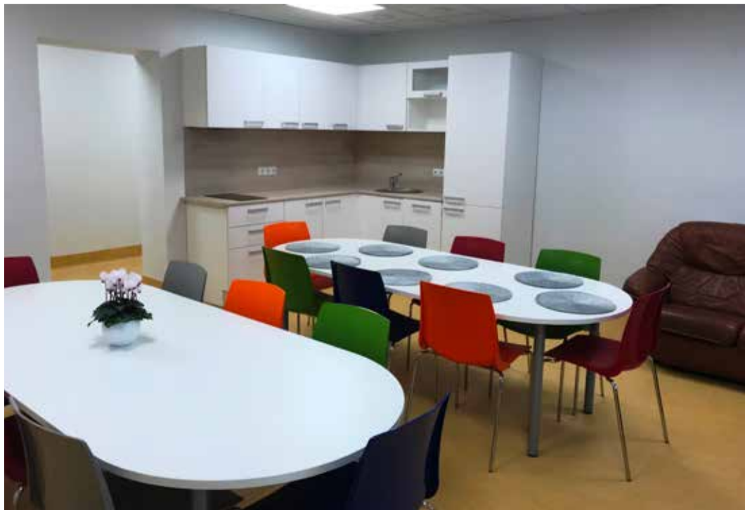
Kesklinna sotsiaalkeskuse filiaal Raua tn 1 on valmis ja ootab juba tulevast nädalast oma kliente.