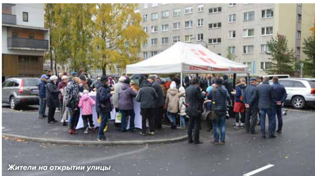
Жители на открытии улицы