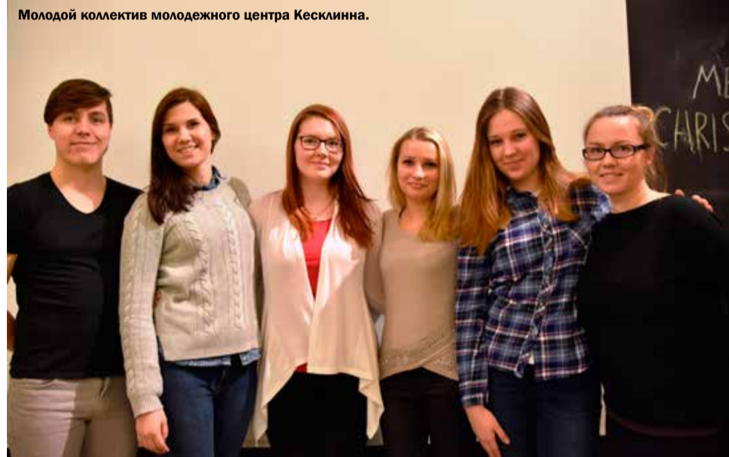
Молодой коллектив молодежного центра Кесклинна.

Мы ждем вас в молодежном центре Кесклинна по адресу Paia, 23. Следите за информацией на нашем веб-сайте или в Фейсбуке: http://www.tallinnaooored.ee/ https://www.facebook.com/tallinnaooored/