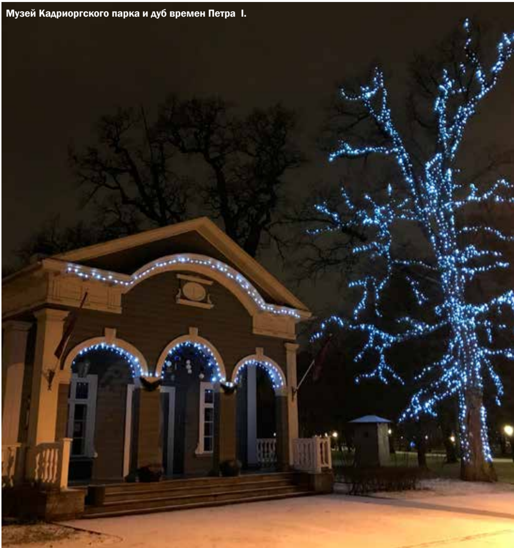
Музей Кадрiorгского парка и дуб времен Петра I.