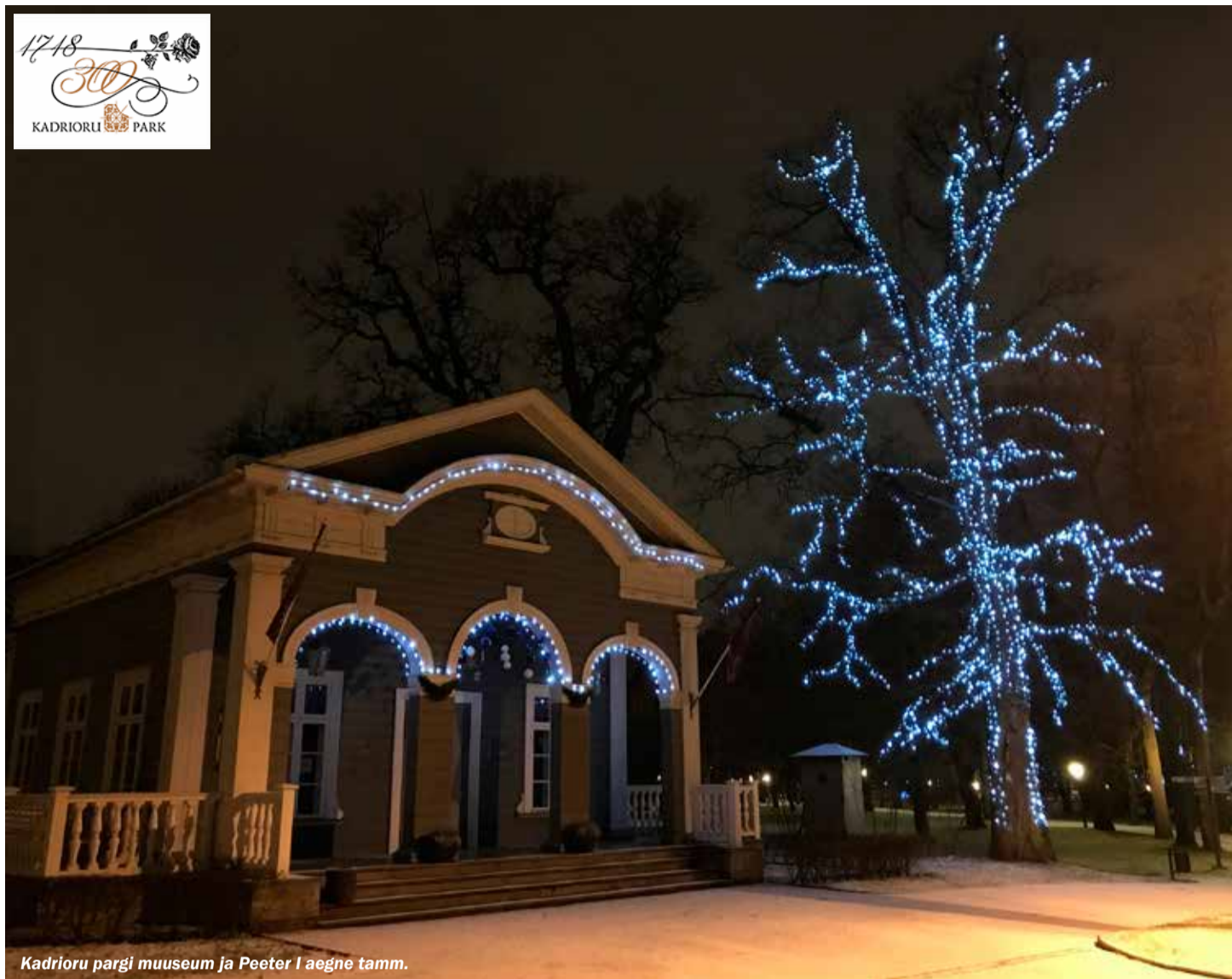
Kadrioru pargi muuseum ja Peeter I aegne tamm.