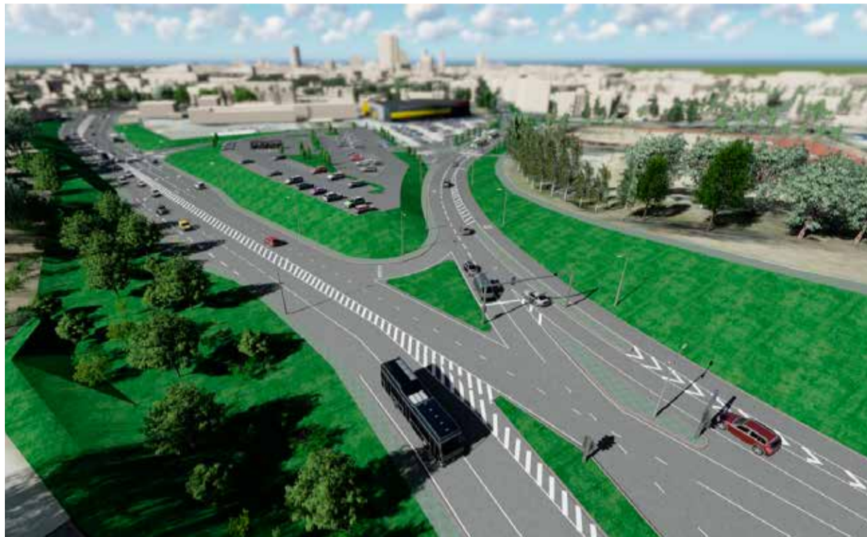
Niisugune vaade avaneb varsti Laagna teelt Gonsiori tänavale.