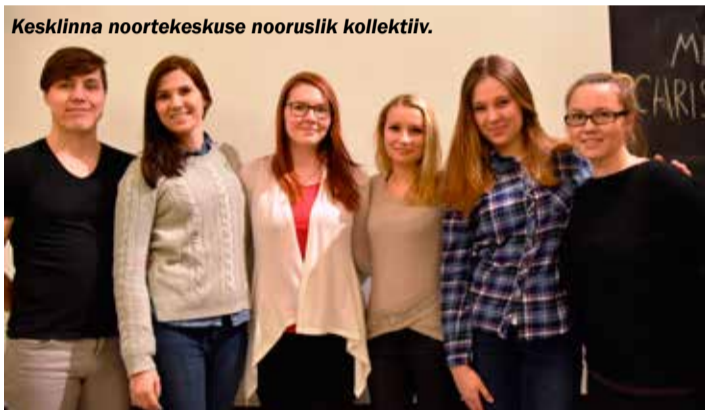
Kesklinna noortekeskuse nooruslik kollektiiv.

Uue tegevuskava raames korraldame veel playback -õhtu, kus noored ja noorsootõtajad saavad