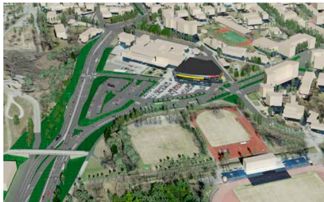
Такой вид вскоре откроется на центр Таллинна со стороны проспекта Лаагна