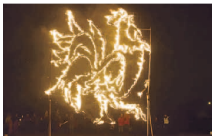
Eelmisel aastal rõõmustas põhjatalinlasi tulekukk, sel aastal on maakoera kord. ■ Aleksandr Gužov

Üritusele pääseb kõige paremini Kalaturu poolsest väravast, võimalusel palume tulla jalgsi või ühistranspordiga, kuna parkimisvõimalused on piiratud. Kohale pääseb bussiga nr 73, peatus Kalarand. ■