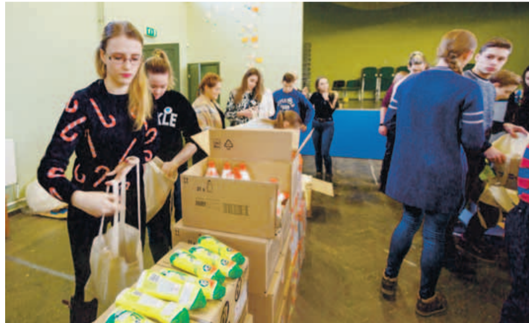
Lisaks koolinoortele osalesid heategevuslikus projektis ka mitmed linnaosakogu esindajad, sh opositsioonilistest erakondadest.