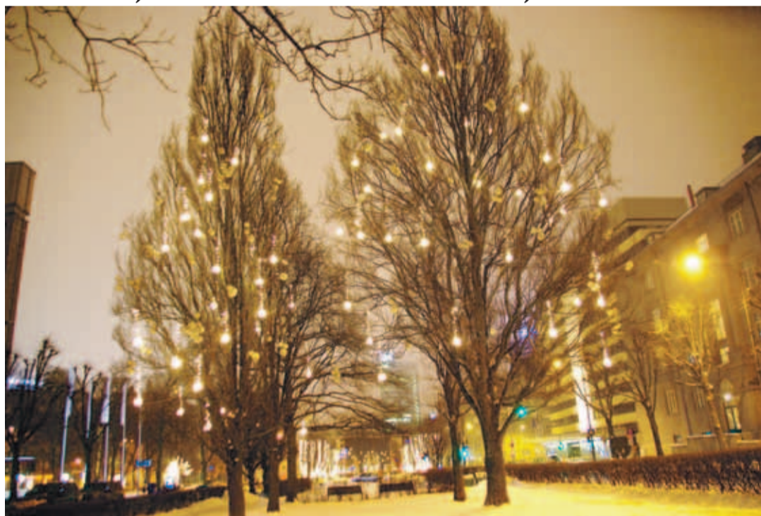
Rahvusvaheliselt tuntud ettevõtte Shishi andis jõuluallee jaoks oma panuse 528 dekoratiivkuuliga. Ants Hansen