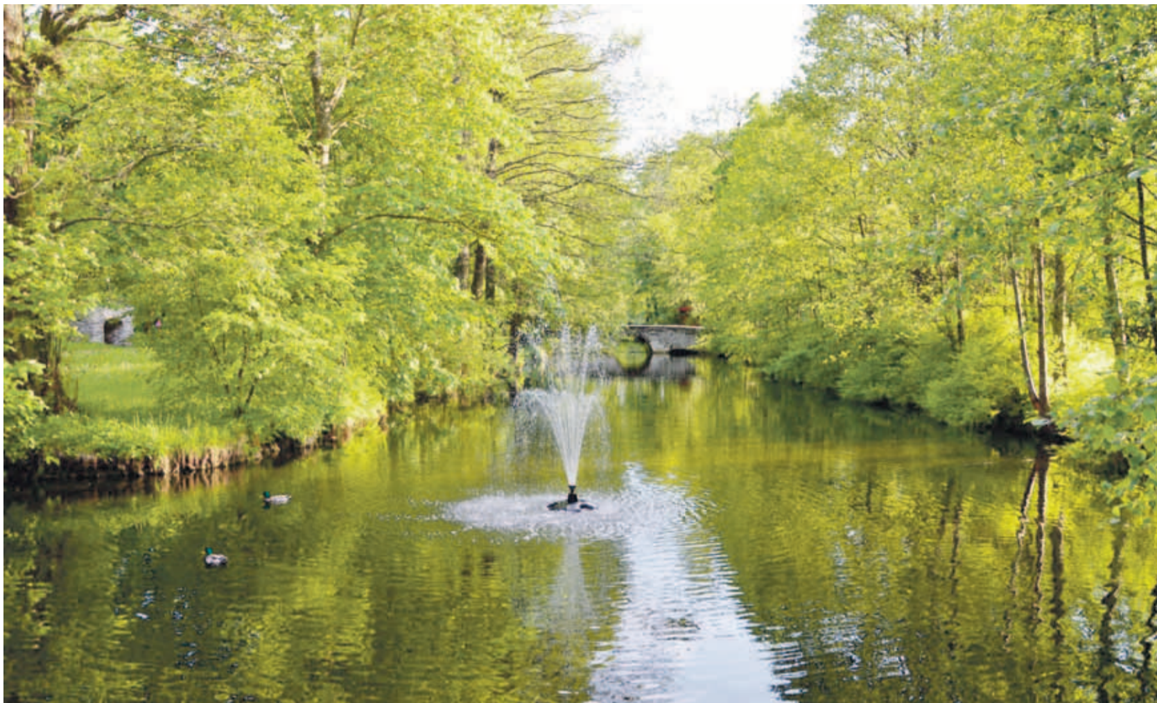
Löwenruh' park saab uue kuue suve alguseks. Kristiine linnaosavalitsus

Löwenruh' pargi silla rajamise lepinguline maksumus on ligi 195 000 eurot ning parkla ehitustööde maksumus on ligi 279 000 eurot. Uue silla rajamise projektdokumentatsiooni koostas OÜ Tilts Eesti Filiaal ning parkla rajamise projektdokumentatsiooni koostas OÜ Keskkonna projekt. Ehitustöid teostab TREF Nord AS ning need algavad lähiajal ja nende lepinguline tähtaeg on käesoleva aasta 30. mai. ■