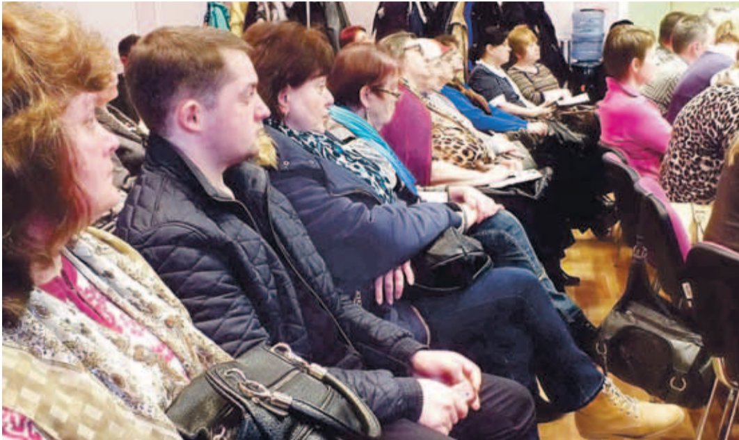
Põhja-Tallinna Valitsuse saalis toimusid 27. ja 28. aprillil korteriomaniike ja korteriühistute esindajatele mõeldud infotunnid gaasihutuse teemal. ■

Korterites, kus tuvastati ümberehitusest või muust tehnilisest puudusest tingitud reaalne oht, on omanikku kohustatud peatama gaasiseadme kasutamine kuni ohu ja puuduste kõrvaldamiseni. ■