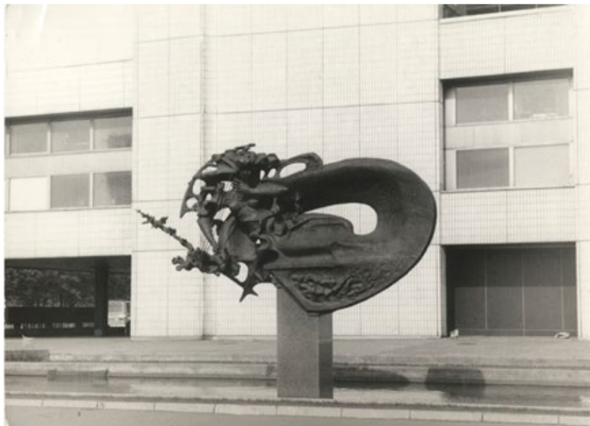
„Merineid” Viru hotelli taustal.