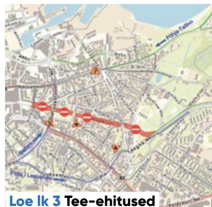
Loe lk 3 Tee-ehitused