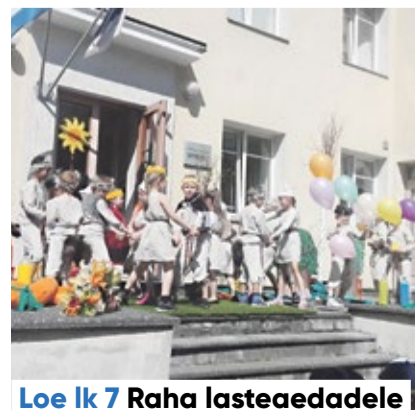
Loe lk 7 Raha lasteaedadele