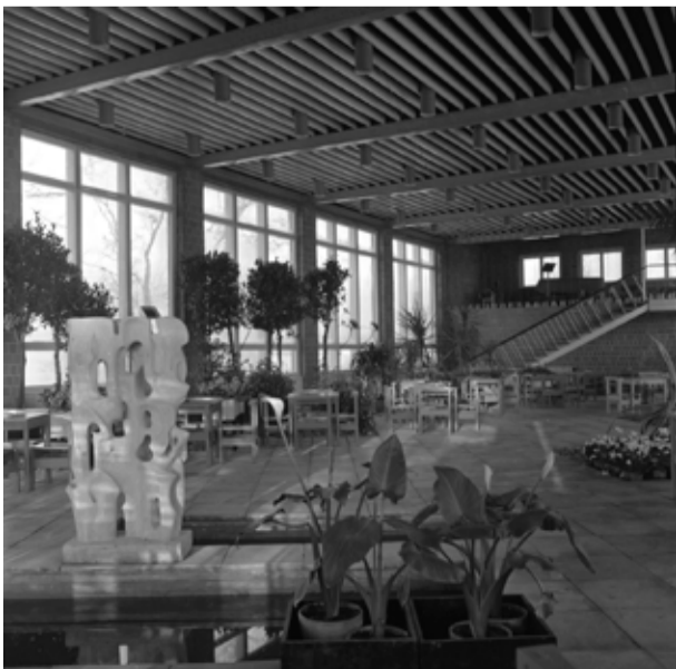
„Kompositsioon” Lillepaviljonis 1967. aastal.