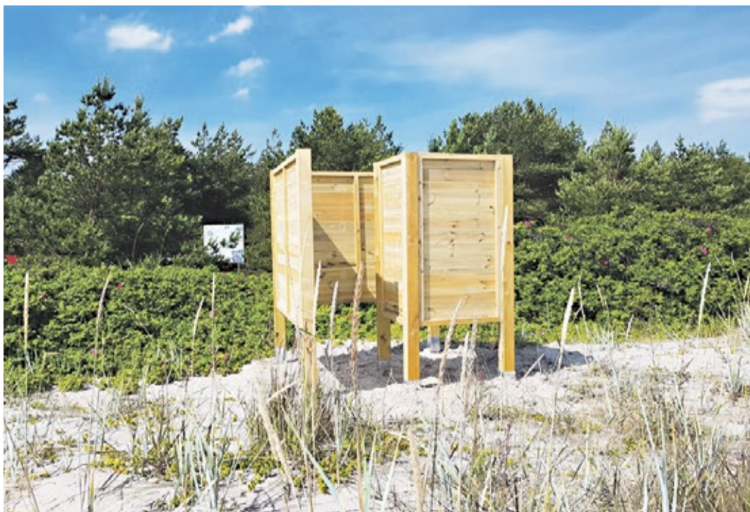
Vaade Aegna lõumarannale.

niliselt võidutule jagamise tseremooniaga, mida viib läbi president. Samal päeval kell 15 jagavad Jüriöö pargis Harjumaa Omavalitsuste Liidu esimees ja Tallinna linna esindaja võidutule edasi kõikidele Harjumaa omavalitsusele ning Tallinna linnaosadele. Pidulikule tulejagamise tseremoonial rivistub üles Vahipataljoni aulvahtkond ja mängib kaitseväge orkester.