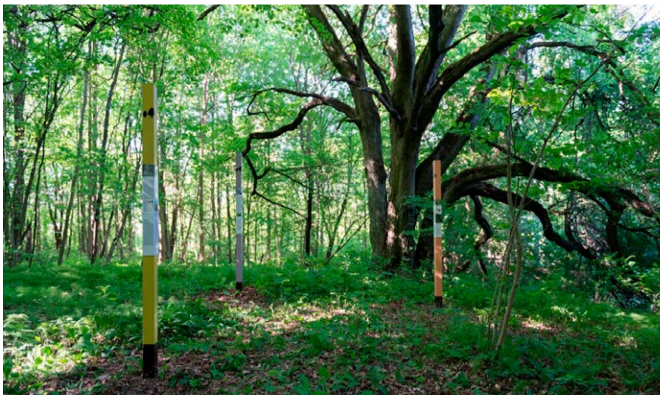
Näitus Veskimetsas.