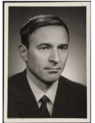
Edgar Viies (1931–2006).

1990. aastad olid kogu eesti kunsti arengus murrangulised, sest kadus senine riiklik ostupoliitika. Turumajanduse tingimustes muutus seni enim kasutatud materjal pronks hinna tõttu enamikule kujuritele kättesaamatuks. Teisalt tekkis professionaalsete kujurite jaoks uus turg Soomes ja Põhjamaades. Tellimusi saadi senisest väiksemate ja intiimsemate tööde loomiseks. Viiese tollasest loomingust moodustavad suure osa portreeskulptuurid Soome akadeemilistest isikutest. Taas ilmuvad materjalina alumiinium