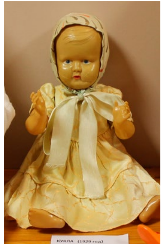
Näitusel olnud nukk 1929. aastast.

24. mail oli aastapäeva puhul kõigi Tallinna lasteade tantsupäev. See algas täpselt ühel ajal ja sama tantsuga kõigil õuealadel. Lastekaitsepäeval, 1. juunil laulsid aga tuhatkond mudilast Vabaduse väljakul peetud lasteade laulupeol. Sündmusi jätkub aasta lõpuni.