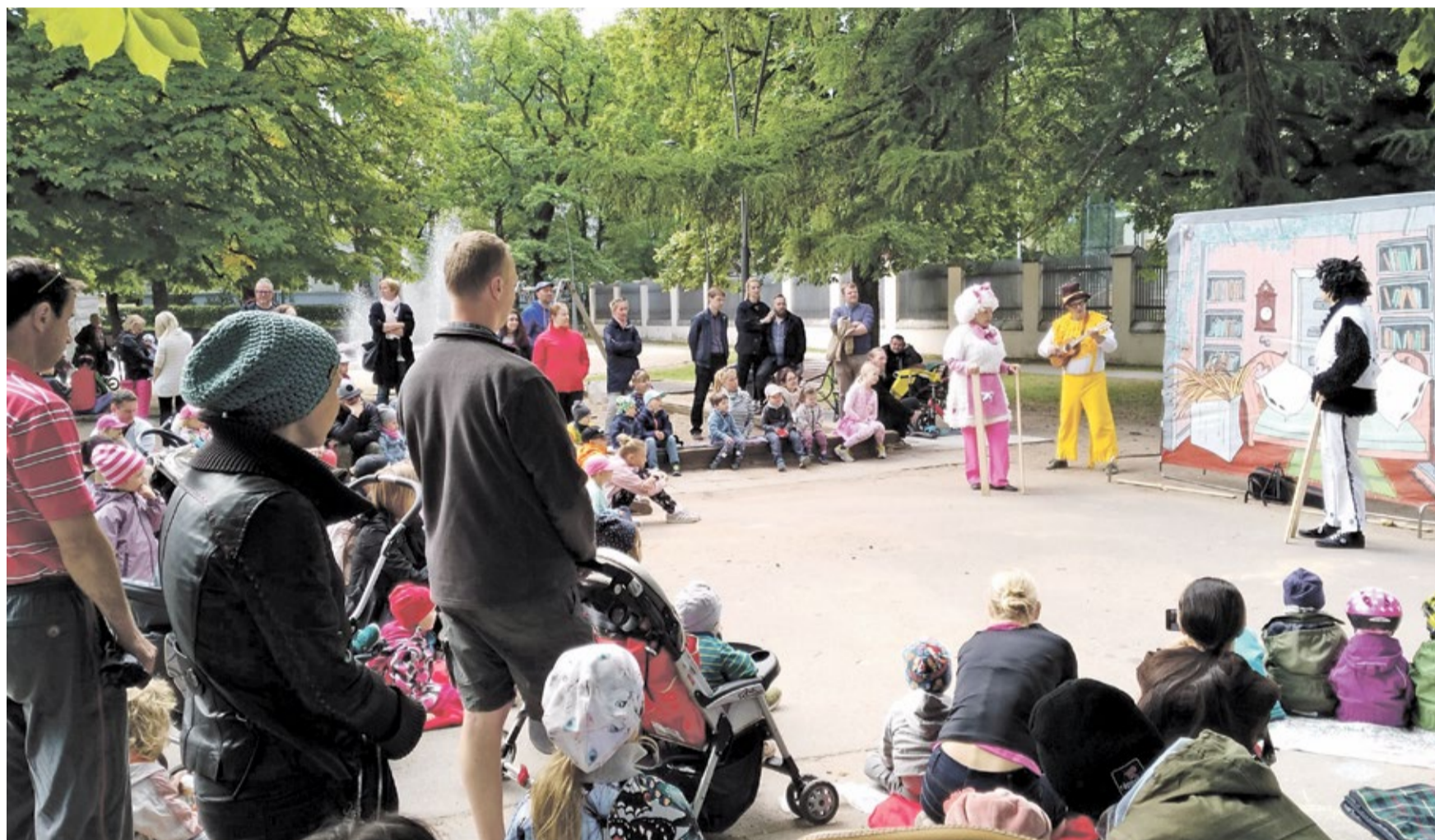
Lasteetenduste suvesari meelitab Kesklinna parkides aega veetma.