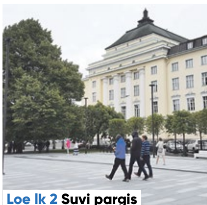
Loe lk 2 Suvi pargis

Allikas: rahvastikuregister, 1. juuni 2018