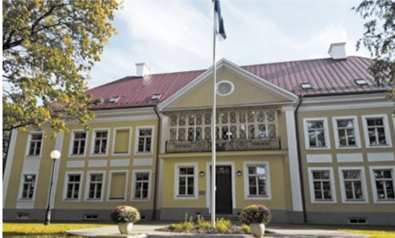
Ühe ilusama näitena restaureerijate heast tööst tõsteti esile Lotte lasteaia hoone.

Samuti märgiti ära Paju 12 eramu Maarjamäe miljööalal, Nõmmel asuv Paju villa ning mitu Kalamaja miljööväärtuslikul alal restaureeritud ehitist. Pikaajalise pühendunud tegevuse eest tunnustati kirglikku muinsuskaitset Tiina Mägi.