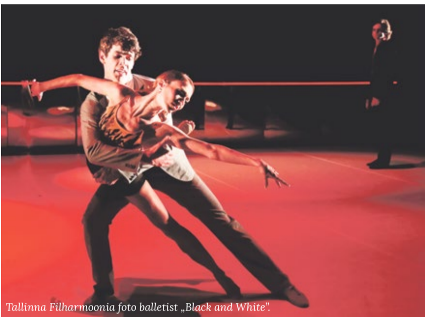
Tallinna Filharmoonia foto balletist „Black and White”.

„Tšehhi rahvusballett toob publiku ette kaks eripalgelist etendust. Neist üks on armastatud „Luikede järve” modernversioon „Black and White”, kus erinevalt originaalst on naispeaosalise asemel keskne kuju hoopis prints. Lugu hargneb kannatuse ja kire ümber, kus must pole enam must ja val-