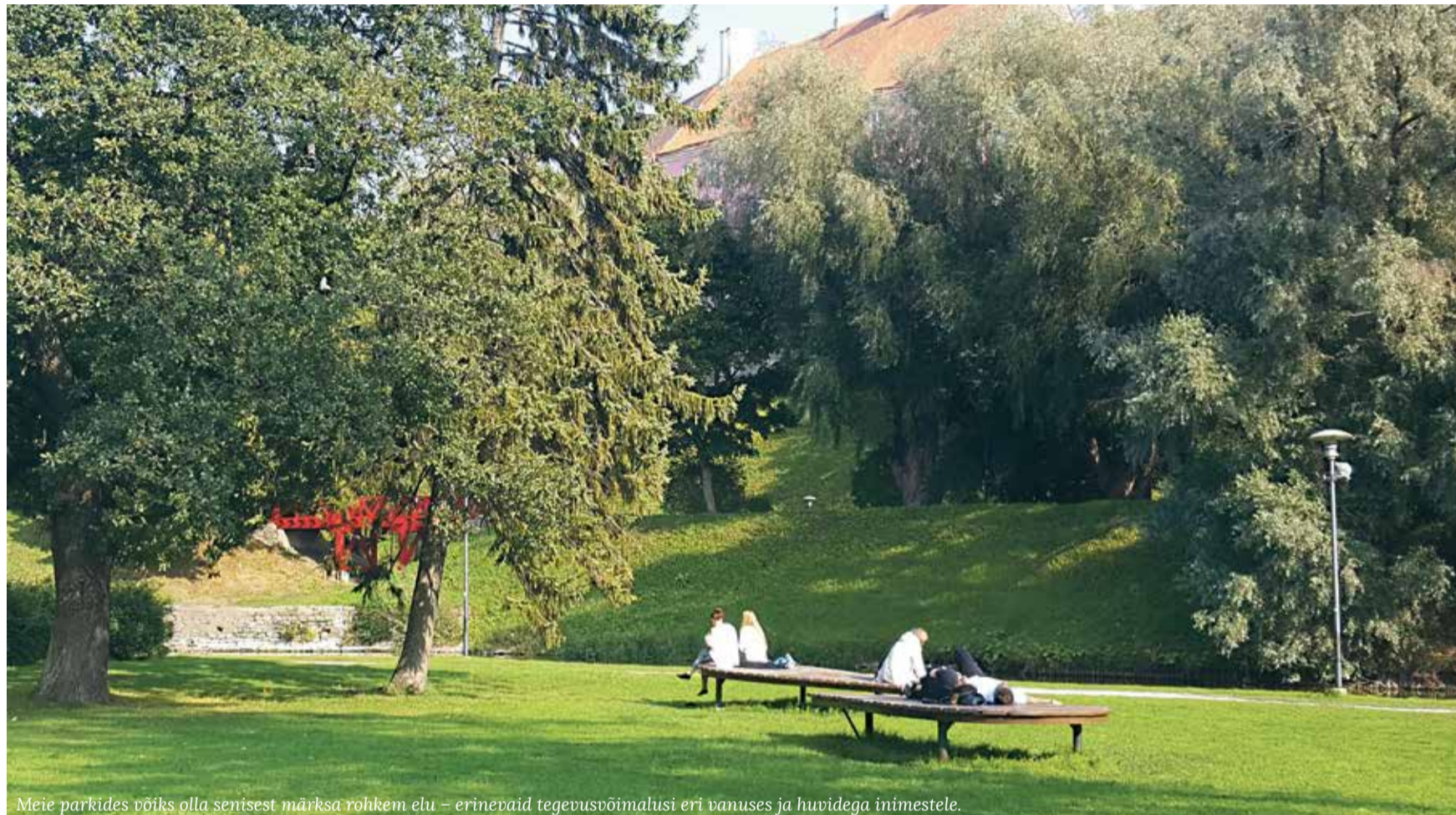
Meie parkides võiks olla senisest märksa rohkem elu – erinevaid tegevusvõimalusi eri vanuses ja huvidega inimestele.