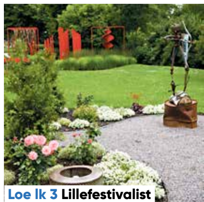
Loe lk 3 Lillefestivalist