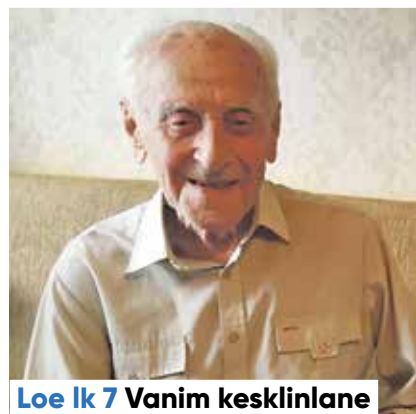
Loe lk 7 Vanim kesklinlane