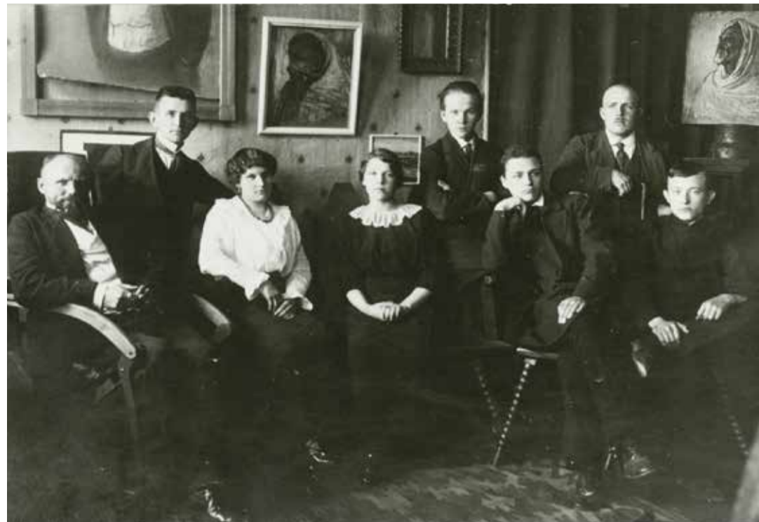
Ants Laikmaa koos oma õpilastega.

„Kui alles kaugel võõrsil Itaalias ja Vahemere taga Aafrikas viibisin, sain kodumaa noortelt pärimisi, millal jälle kodumaale tulen ja siin endiselt õpetamisega algan. /---/ Sügisel 1913 avasin siis jälle õpehimulistele