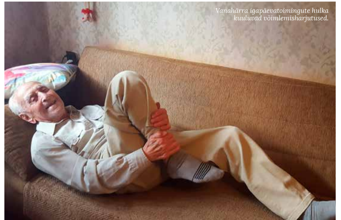
Vanahärra igapäevatoimingute hulka kuuluvad võimlemisharjutused.