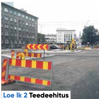
Loe lk 2 Teedehitus