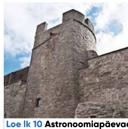
Loe lk 10 Astronoomiapäevad

Kesklinna Sõnumite järgmine number ilmub 19. oktoobril.