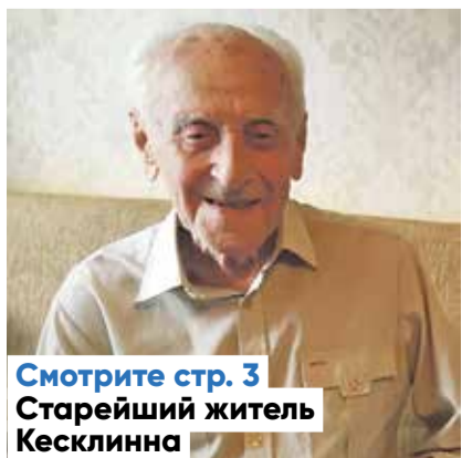
Смотрите стр. 3 Старейший житель Кесклинна