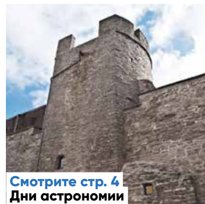
Смотрите стр. 4 Дни астрономии

Следующий номер газеты Keskklinna Sõnumid выйдет 19 октября.