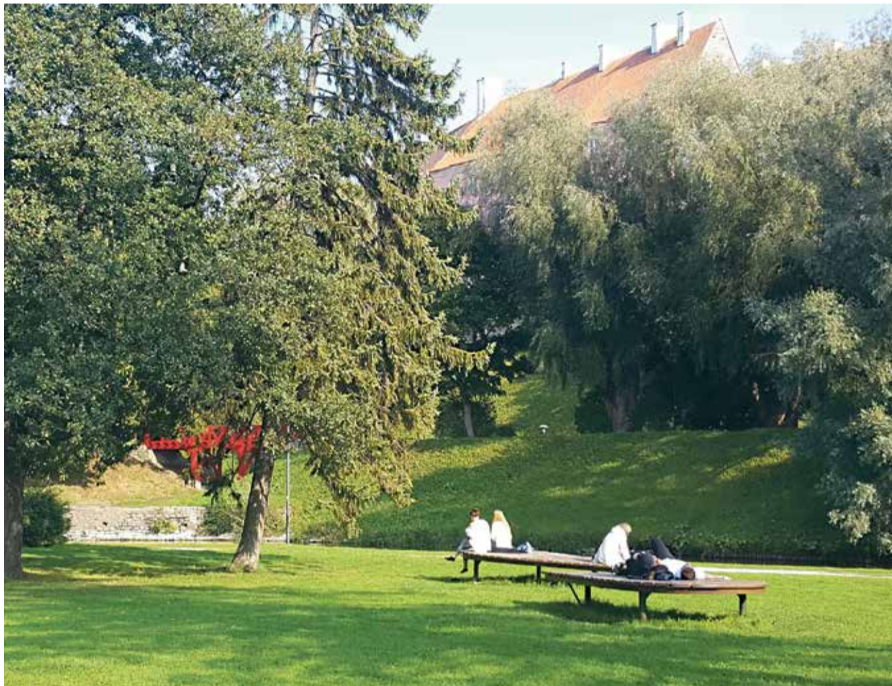
В наших парках могло бы быть заметно оживленнее – различные возможности занятий для людей разного возраста и с разными интересами.