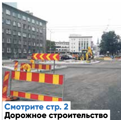
Смотрите стр. 2 Дорожное строительство

Источник: Регистр народонаселения, 1 сентября 2018 г.