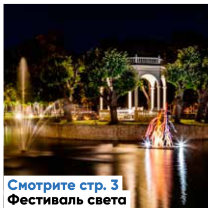
Смотрите стр. 3 Фестиваль света