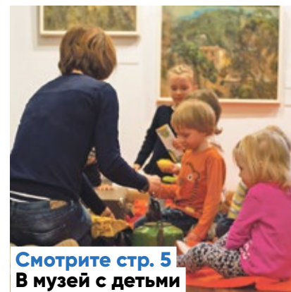
Смотрите стр. 5 В музее с детьми

Следующий номер газеты Kesklinna Sõnumid выйдет 16 ноября.