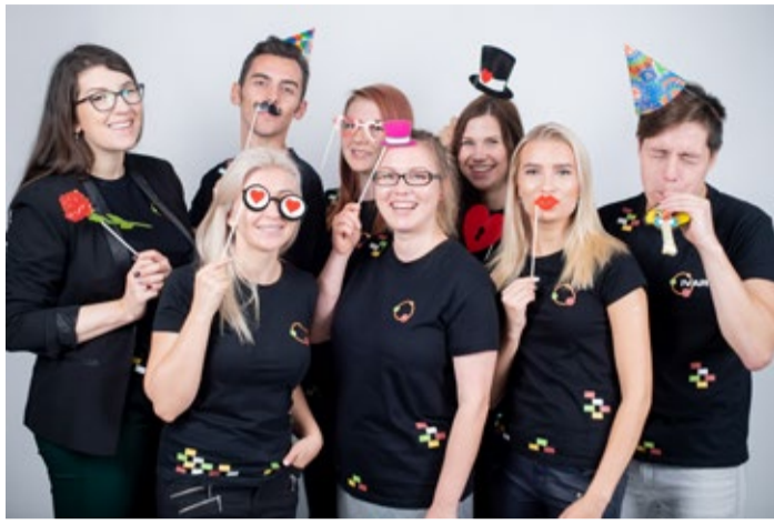
Нынешние работники молодежного центра.

главными инициаторами событий, а сотрудничество между молодежью и молодежными работниками развивается успешно и строится на доверии. Все работники центра любят свою работу и очень мотивированы работать каждый день ради того, чтобы наши посетители – подростки чувствовали себя в центре хорошо и уютно, чтобы они знали, что их здесь всегда рады видеть.