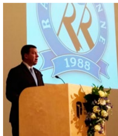
На исторической конференции выступил премьер-министр Юри Ратас.

В музее Народного фронта на площади Вабадузе можно ознакомиться с двумя выставками: экспозиция «1988» напоминает нам о событиях и эмоциях переломного года, а выставка «Лозунги на пути к независимости» знакомит с призывами тех лет – в основном в духе борьбы, но также и шутивными.