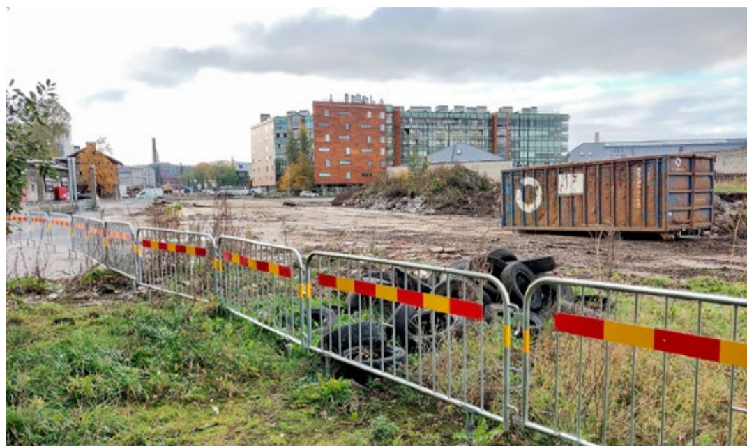
Коридор, по которому пройдет дорога Рейди, на сегодняшний день расчищен.

оборудованы зеленые зоны. Улицу планируется открыть для движения во второй половине ноября, когда все крупные работы там должны быть завершены; мелкие работы продолжатся в соответствии с изначально установленными планами. До весны следующего года движение по улице Гонсиори продолжится по той же схеме, что и до ремонта.