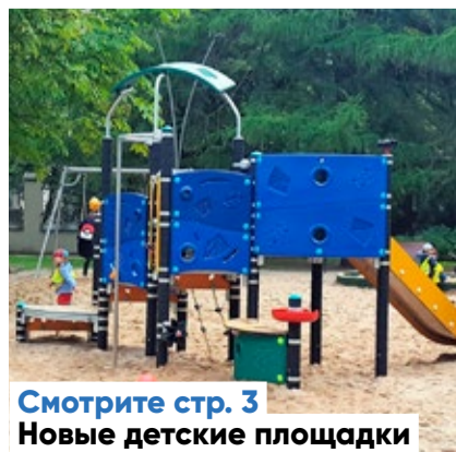
Смотрите стр. 3 Новые детские площадки