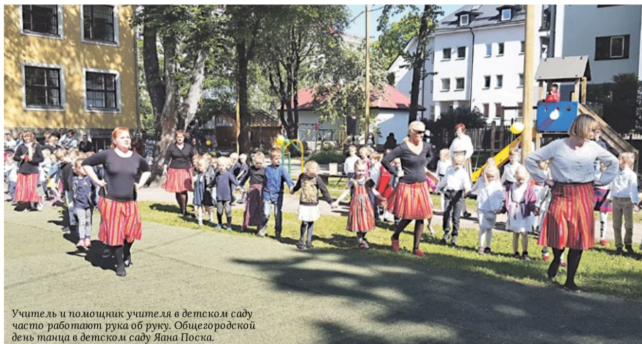
Учитель и помощник учителя в детском саду часто работают рука об руку. Общегородской день танца в детском саду Яана Поска.