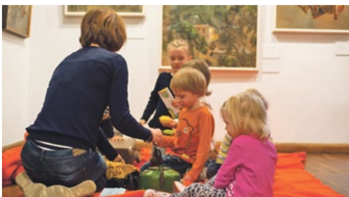
В музее Адамсона-Эрика.

В музеи можно пройти по музейному билету. Помимо основной программы, там проводятся также открытые