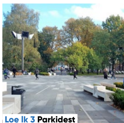
Loe lk 3 Parkidest