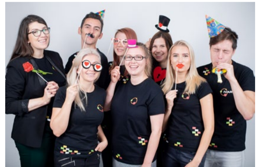
Noortekeskuse nüüdsed töötajad.

Jälgige meid kodulehel või Facebookis: www.tallinnanoored.ee/ , www.facebook.com/tallinnanoored/ .