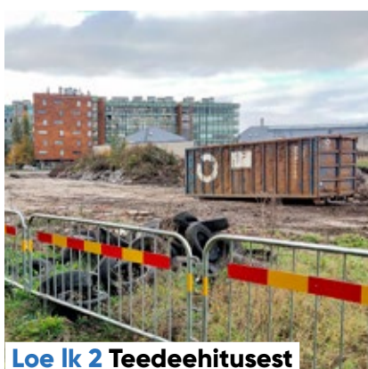
Loe lk 2 Teedeehitusest

Kesklinna õpetajaabide motivatsioonipäeva hindasid seal osalenud aga sisukaks ja innustavaks. Pärast loengut ja kohvipausi vaadati päeva teisel poolel kinos Artis uut linasteost „Astrid Lindgreni rääkimata lugu“.