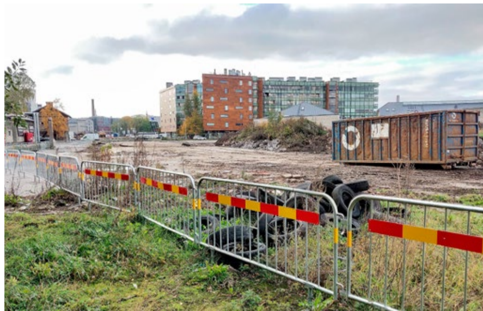
Tulevase Reidi tee kulgemise koridor on nüüdseks puhastatud.

10. oktoobriks oli seis Kesklinna tänavate rekonstrueerimise, remondi ja ehitusega järgmine: