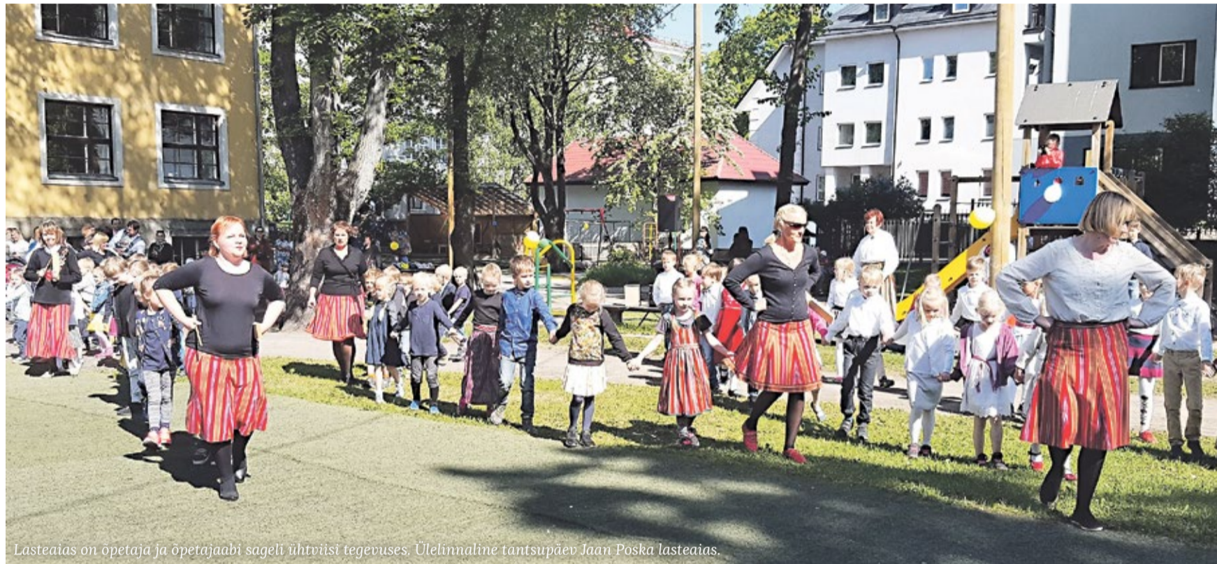
Lasteaias on õpetaja ja õpetajaabi sageli ühtviisi tegevuses. Ülelinnaline tantsupäev Jaan Poska lasteaias.