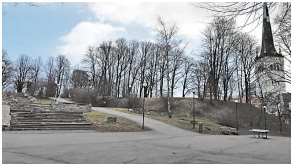
Lahendust ootab Skåne bastioni parem ühendus vanalinnaga.