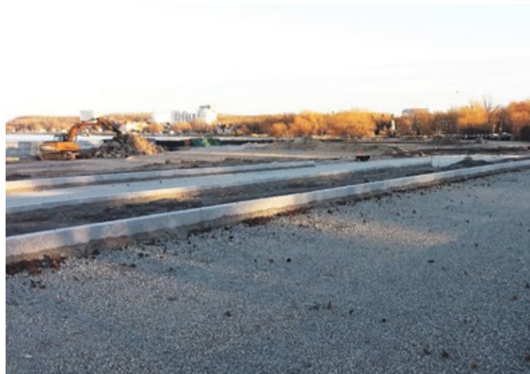
2. detsembril tehtud fotol on näha Reidi tee ala (kuhu tuleb 2+2 sõidurada) ning kergliiklustee ja rannapromenaadi jaoks täidetud ala. Taamal paistab Russalka, samuti 2017. aasta Euroopa puu kandidaadist saja-aastane tamm ja Narva maantee liiklus.

Käimas on mereäärse uue tugiseina ehitamine, ligemale poolesaja meetri laiuse mereala täitmine, tehnosüsteemide rajamine ja tee nähtava osa (sõidu- ja kergliiklustee) ehitamine. Seejuures on mullatööde maht väga suur, peale pressib vesi nii mere