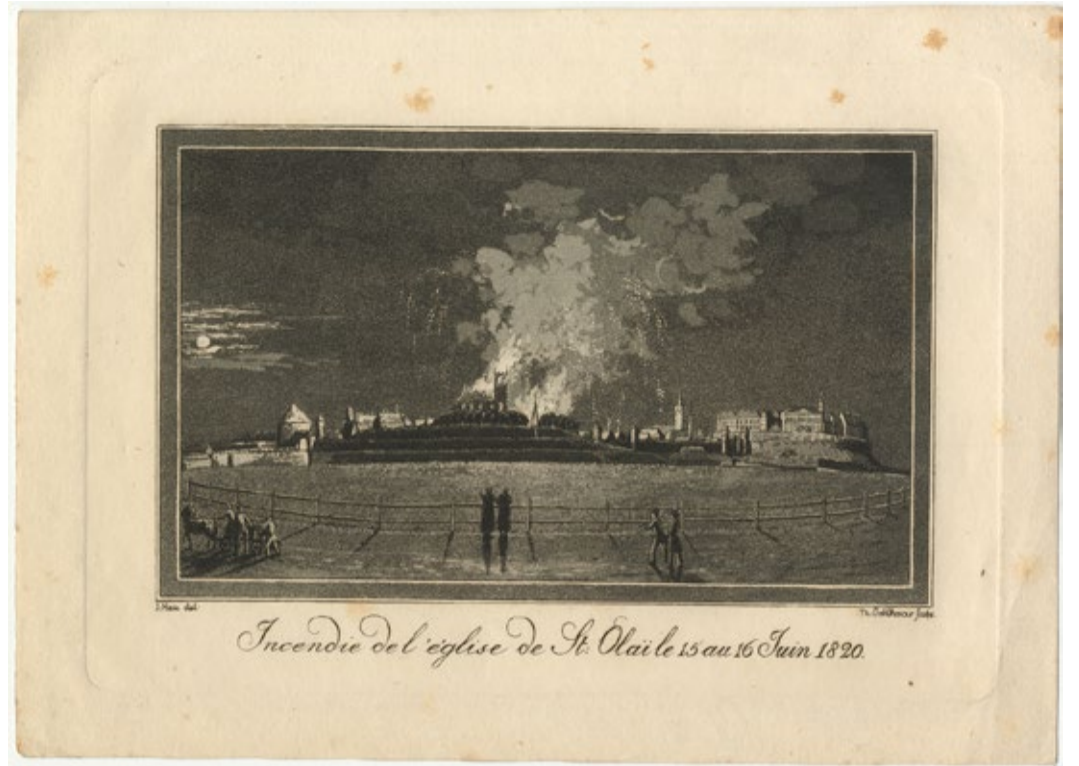
Oleviste kiriku põlemine. Linnamuuseum

põhineb peamiselt hoopis tema raamatugraafikal. Viimastel aastakümnetel on tema töödest enam tähelepanu pälvinud ajaloopildid sarjast