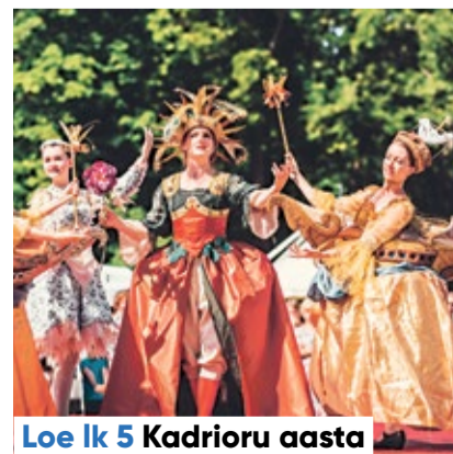
Loe lk 5 Kadrioru aasta

Kesklinna Sõnumite järgmine number ilmub 16. jaanuaril.