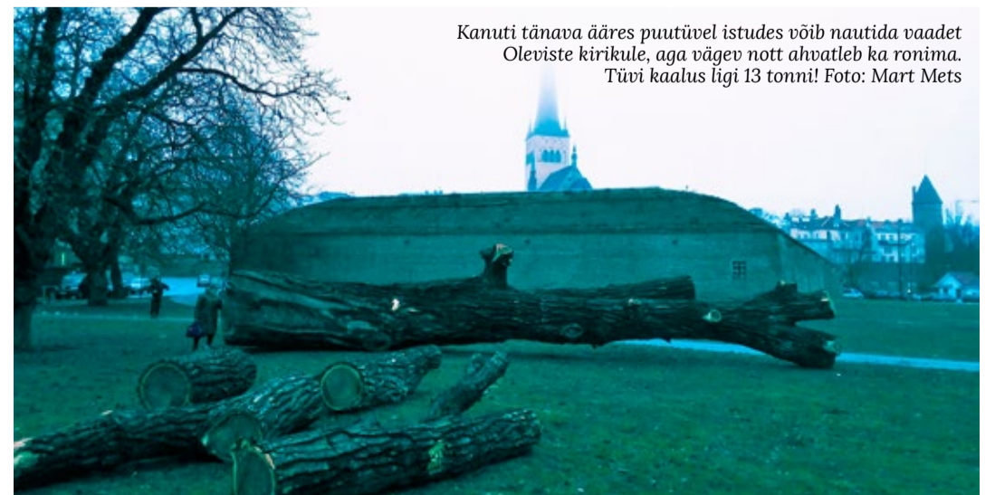
Kanuti tänava ääres puutüvel istudes võib nautida vaadet Oleviste kirikule, aga vägev nott ahvatleb ka ronima. Tüvi kaalus ligi 13 tonni!

Puu väärtustamiseks on see nüüd eksponeeritud Kanuti tänava ääres. Sarnaseid vanu, suuri ja väärikaid musti pappeid võib näha veel näiteks Wismari 35 ja Roosikrantsi 4 hoovis.