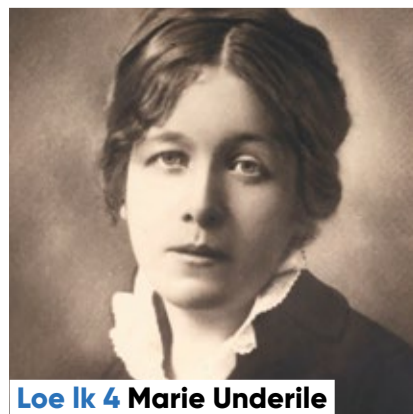
Loe lk 4 Marie Underile