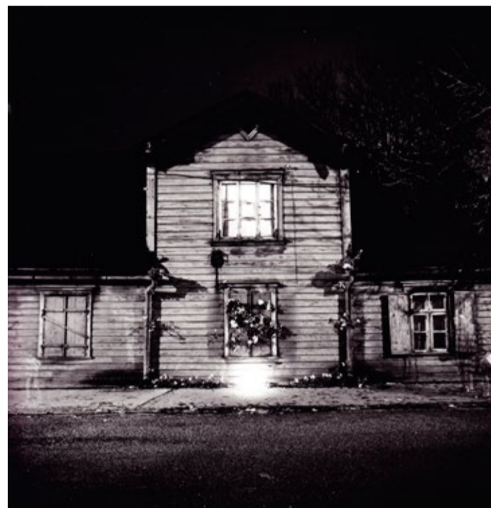
Tallinlased töid paguluses elanud ja surnud luuletaja sünnimaja juurde tema surmapäeval rohkesti lilli.

Tahvli paigaldamine on osa Kesklinna valitsuse projektist eesti kultuuri- ja ajaloo oluliste sada aastat tagasi linnaruumis olnud rajatiste tähistamiseks infotahvliga.