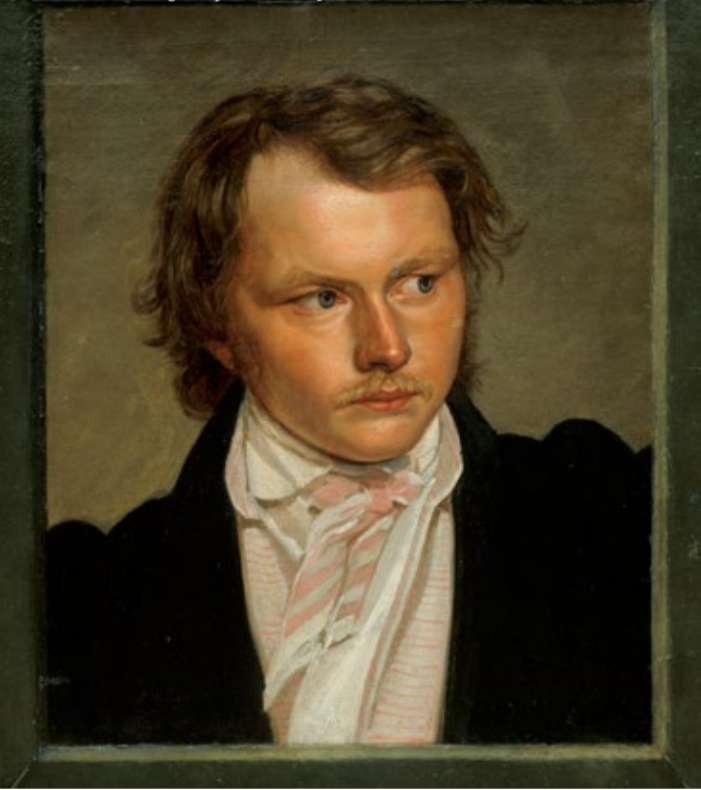
Friedrich Ludwig Maydelli autoportree. Eesti kunstimuuseum