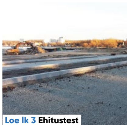
Loe lk 3 Ehitustest