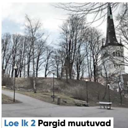
Loe lk 2 Pargid muutuvad