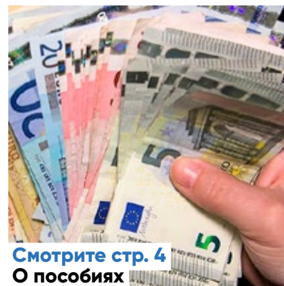
Смотрите стр. 4 О пособиях

Следующий номер газеты Kesklinna Sõnumid выйдет 16 января.