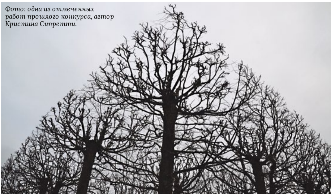
Фото: одна из отмеченных работ прошлого конкурса, автор Кристина Сипретти.