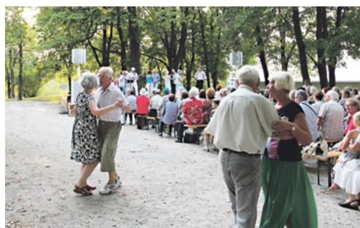
Летние концерты привлекли в парк Пооламяги множество народу, в том числе и любителей потанцевать.

В качестве первых шагов в ближайшие месяцы Свет назвал поиск решений по созданию возможностей общения между садом Канути и кварталом Ротерманна, а также бастионом Скоонне и Старым городом. В самом скором времени получат освещение игровая площадка в саду Канути и парк Пооламяги, будет снесен сарай на берегу пруда Шнелли и прорежена группа кустов та-мошнего «Гайд-парка».