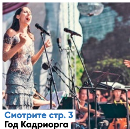
Смотрите стр. 3 Год Кадриорга