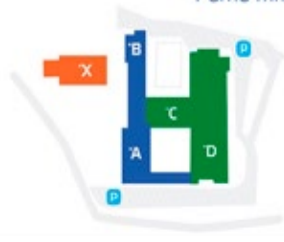
Смотрите стр. 3 Новый центр здоровья