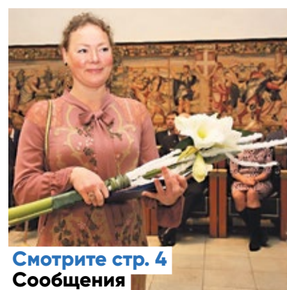
Смотрите стр. 4 Сообщения

Следующий номер газеты Kesklinna Sõnumid выйдет 13 февраля.