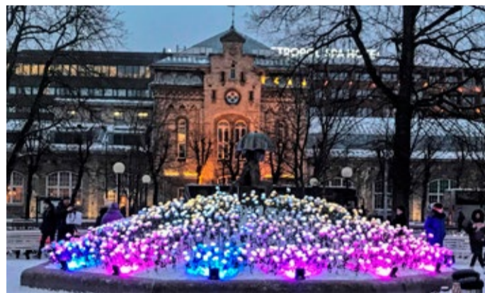
В саду Канути засияла композиция из LED-роз.

Фестиваль и представляемое в его рамках прекрасное зрелище будут интересны гостям любого возраста. Зрители также смогут принять участие в проводящемся во время мероприятия фотоконкурсе. Лучший снимок фаерщика, сделанный