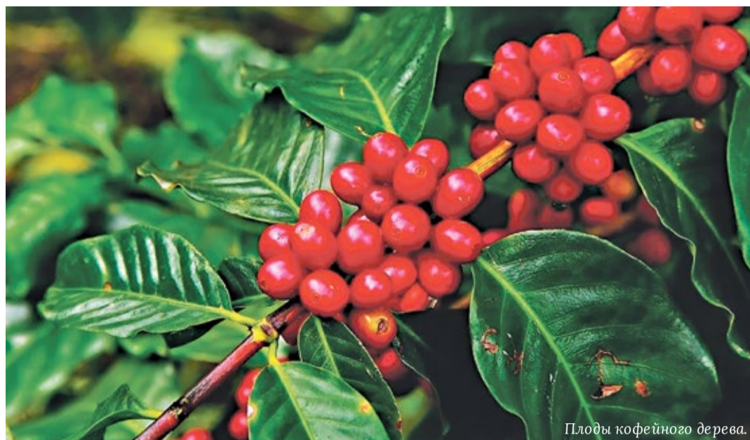
Плоды кофеинного дерева.

Представлять кандидатов на конкурс в районную управу можно по электронной почте до 15 марта.