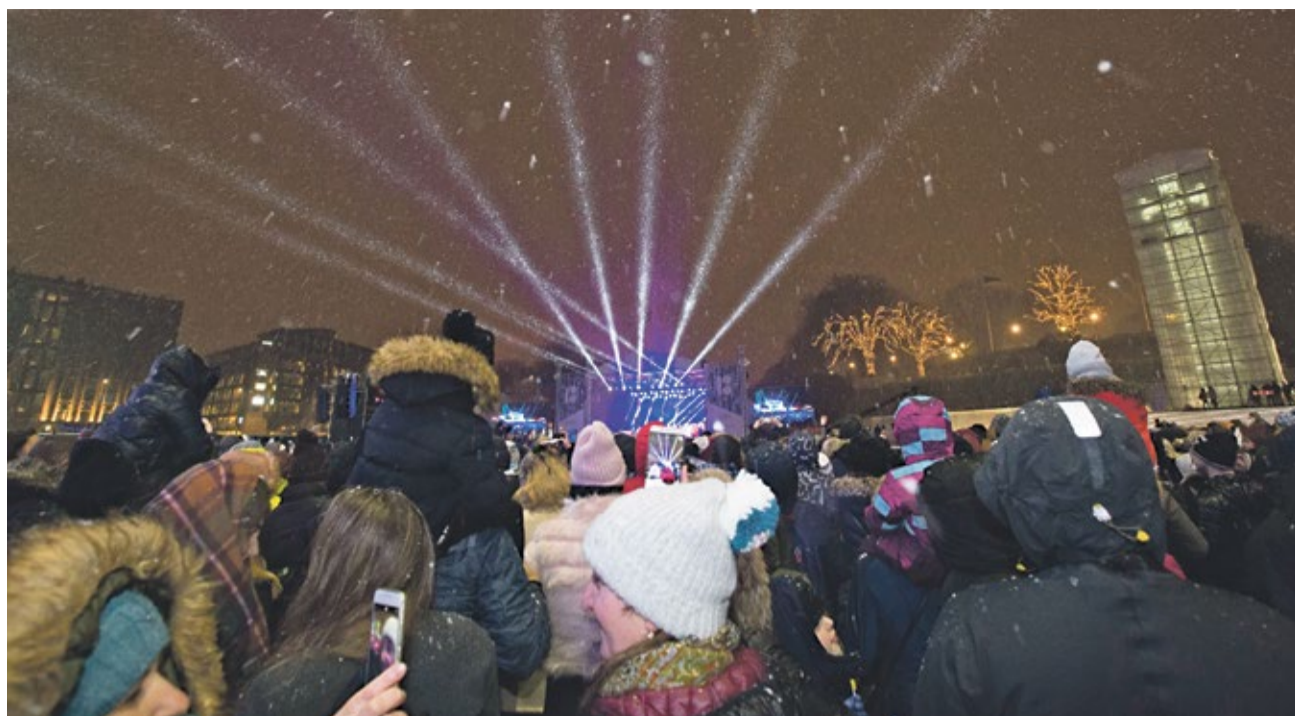
Почти 20 000 человек собрались на площади Вабадузе, чтобы посмотреть на фейерверк.