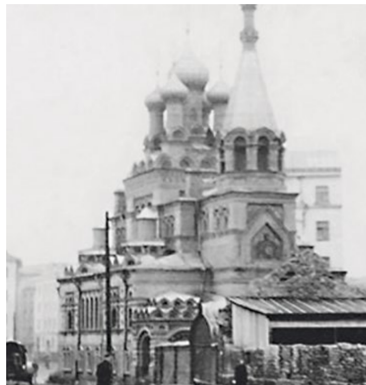
Бывшее подворье Пюхтицкого монастыря.

Франк безответно влюблен в Тину, которая не может ответить ему взаимностью. Ее муж совсем недавно погиб в автокатастрофе. Во время путешествия на Бали, где Тина пытается вернуть утраченную волю к жизни, Франк постепенно становится ее гидом, компаньоном и, наконец, другом. Сможет ли Тина полюбить его?