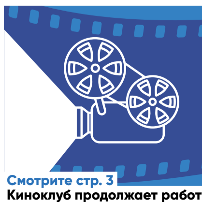
Смотрите стр. 3 Киноклуб продолжает работу