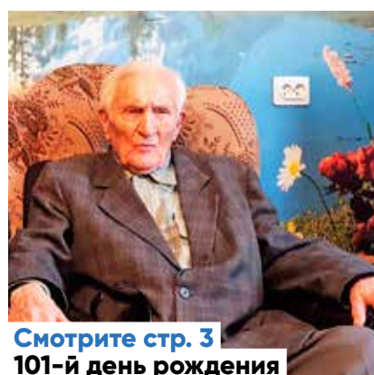
Смотрите стр. 3 101-й день рождения