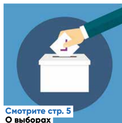
Смотрите стр. 5 О выборах