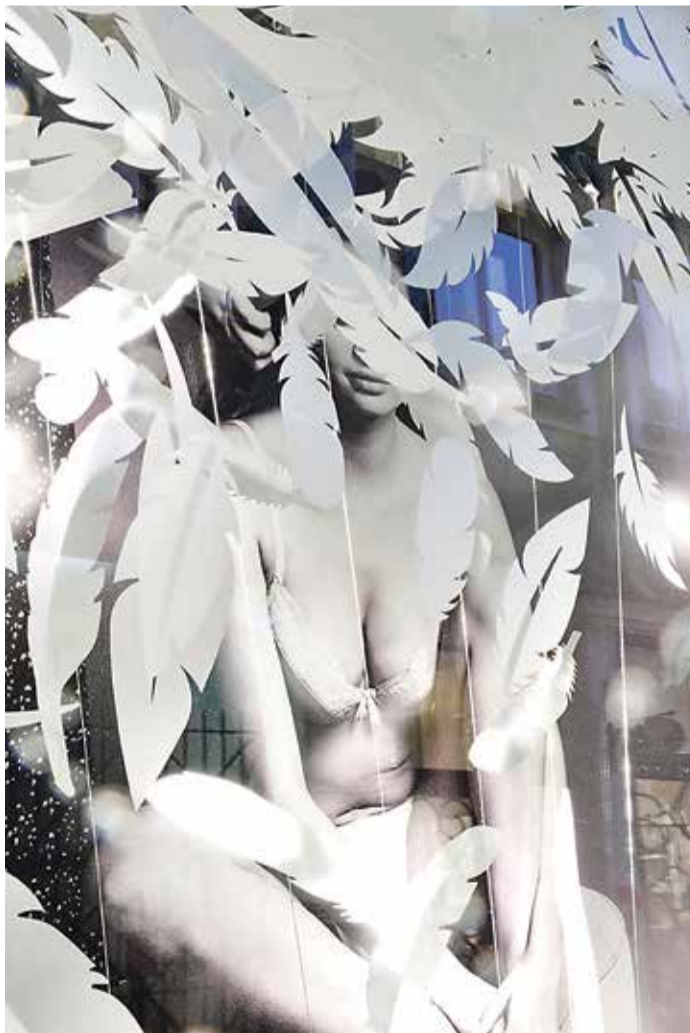
Признанное лучшим окно магазина Linette.