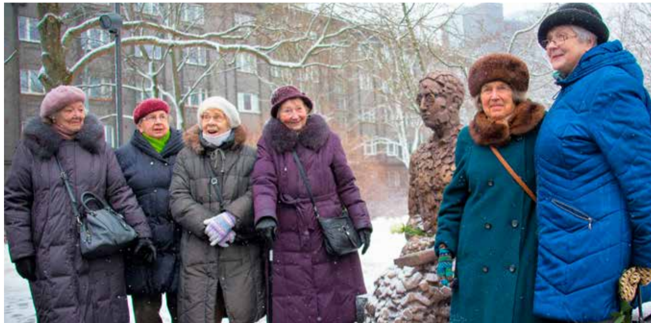
Выпускницы частной гимназии Эльфриде Лендер на церемонии открытия памятника основательнице своей школы.