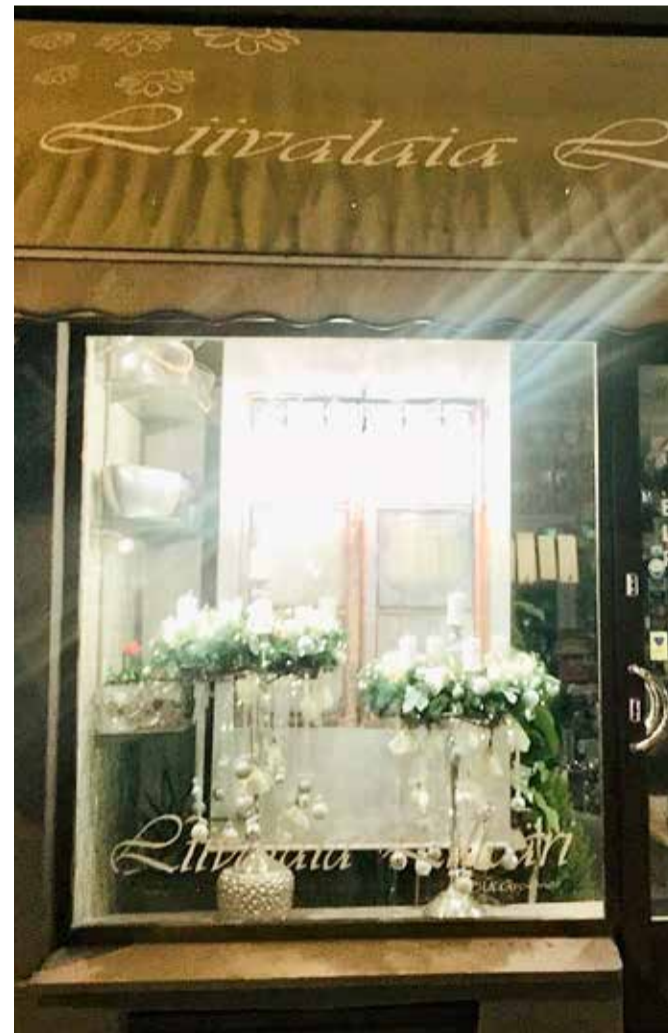
Фасад цветочного магазина, победившего на голосовании в Фейсбуке.