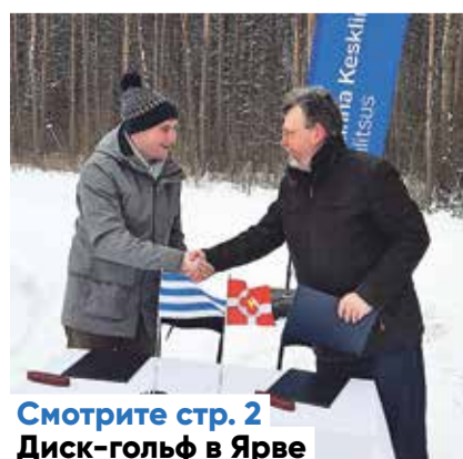
Смотрите стр. 2 Диск-гольф в Ярве