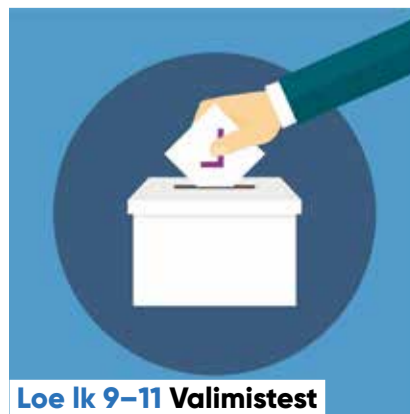
Loe lk 9–11 Valimistest