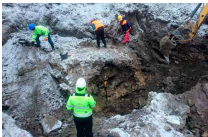
Trepikäigu suudme väljakaevamine nõukogudeaegse suveteatri hoone all 2018. aasta lõpus.