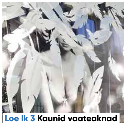
Loe lk 3 Kaunid vaateaknad