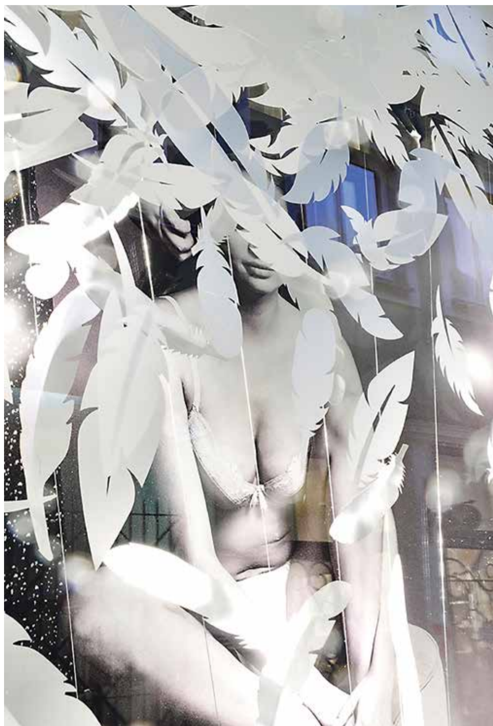
Parimaks hinnatud Linette kaupluse aken.