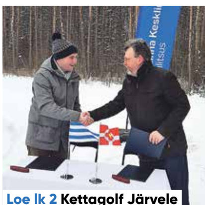
Loe lk 2 Kettagolf Järvele