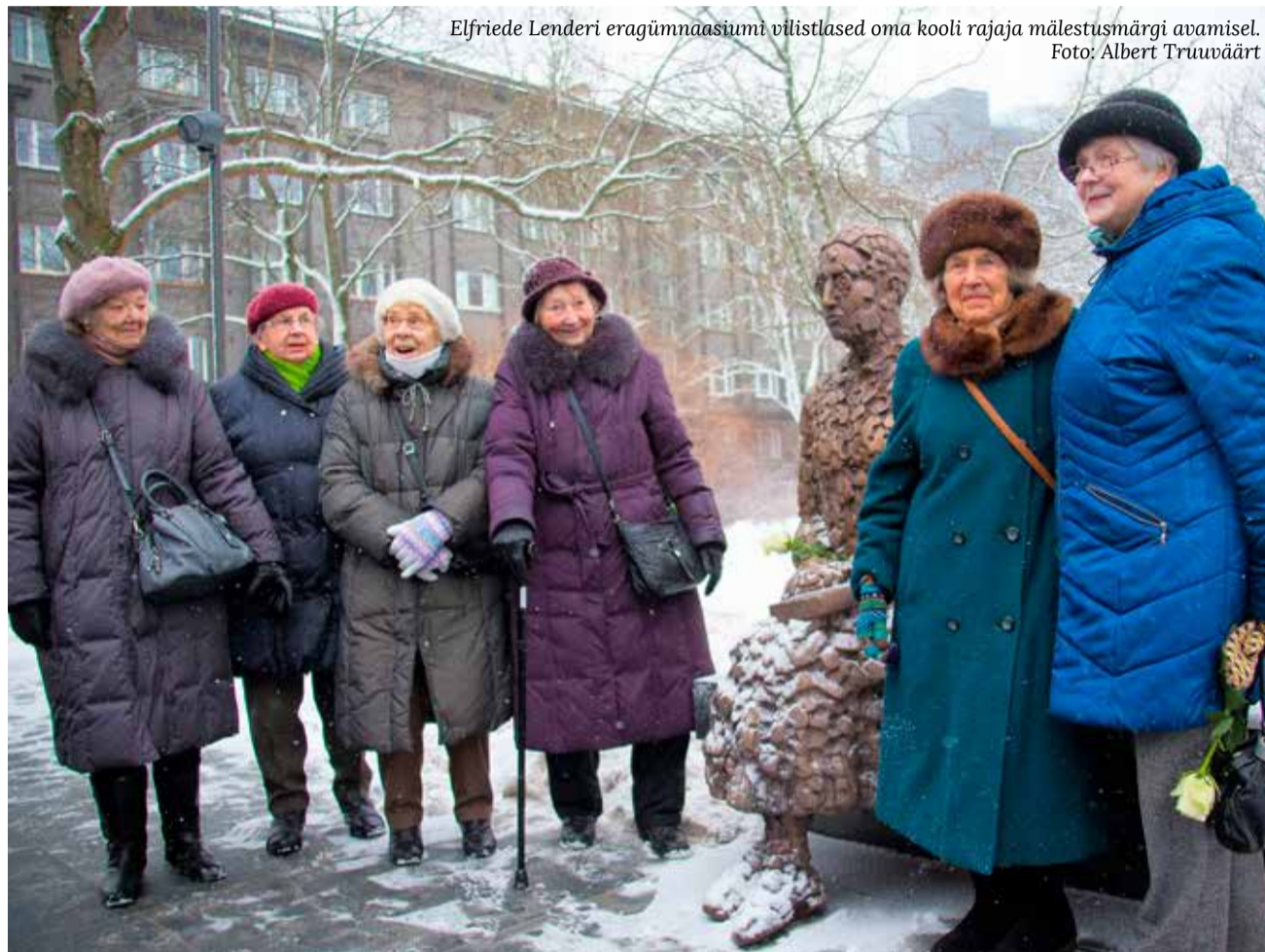
Elfriede Lenderi eragümnaasiumi vilistlased oma kooli rajaja mälestusmärgi avamisel.

kool Eestimaa kubermangus. Kui septembris 1907 alustas kool 81 õpilasega, kellest enamik oli kehvadest oludest pärit, siis 1917. aastal õppis Lenderi koolis juba 461 tütarlast. 1935. aastal sai gümnaasium endale uue maja, kus tegutses 1940. aastani. Seejärel moodustati gümnaasiumi ja Tallinna erakolledži osalise ühinemise tulemusena Tallinna 8. keskkool. Praegu samas majas tegutsev kool kannab Kesklinna vene gümnaasiumi nime.