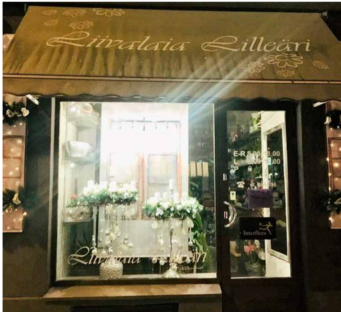
Facebooki-hääletusel võidutsenud lilleäri fassaad.

ja Tassikoogid Olevimägi 11. Kõiki kolme tunnustab linnaosavalitsus rahapreemiaga. Samuti saab preemia aadressil Liivalaia 27 asuv lilleäri, mille vaateaken pälvis rahva lemmiku tiitli Facebookis korraldatud hääletusel.