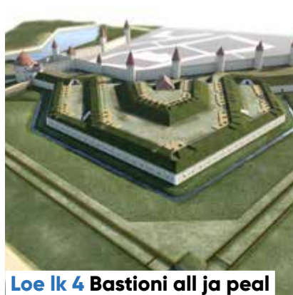
Loe lk 4 Bastioni all ja peal