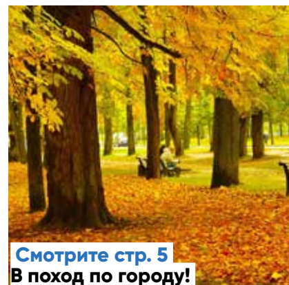
Смотрите стр. 5 В поход по городу!

Следующий номер Kesklinna Sõnumid выйдет 13 ноября.