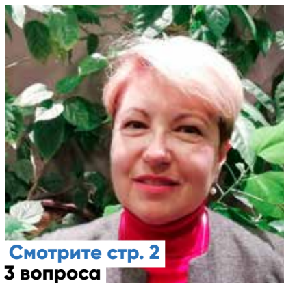
Смотрите стр. 2 3 вопроса