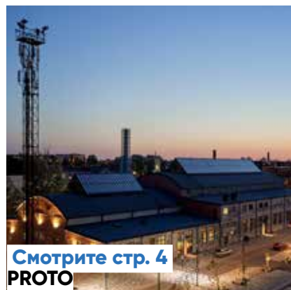
Смотрите стр. 4 PROTO