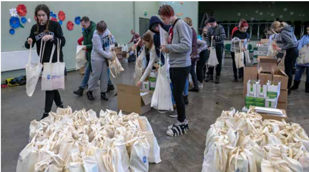
Eelmise aasta jaanuaris toimetasid vabatahtlikud rohkem kui tuhandele üksi elavale eakale koju linnaosavalitsuse abipakid, milles olid erinevad kodumajapidamises vajalikud tarbed. Ilja Matusihis

Kuna töömaht on suur, kutsub linnaosa valitsus kõiki soovijaid heategevusliku projektiga liituma. Teretulnud on nii koolinoored (vajalik vanemate nõusolek) kui täiseas abilised! Töötame vanurite heaks juba järgmi-