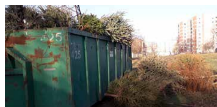
Linnaosavalitsus tuletab meelde, et konteinerisse ei ole lubatud panna kilekotte ega ehteid.

dest tehtud lõkke süütamisega 25. jaanuaril Lennusadama ja Noblessneri vahelisel alal (Vesilennuki 12), kus toimub meeleolukas Metallroti aasta avamine. ■