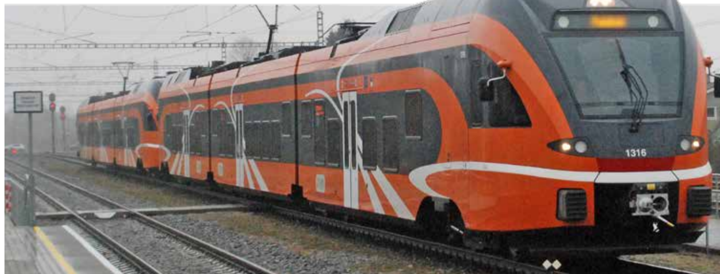
Kopli on raudteerööpad praegugi maas, et reisiringid saaksid seal aga kavandatud kiirusega sõita, vajab põhjalikku remonti ja ümberehitamist.