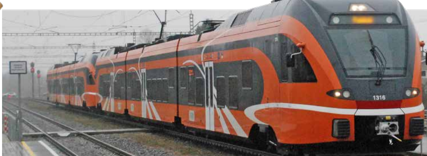
Железная дорога в Копли сохранилась, но для того, чтобы использовать ее для пассажирского сообщения, ее надо отремонтировать и достроить. Allar Viivik

О недостатках в сфере благоустройства просим информировать муниципальное учреждение по короткому номеру 14410. ■