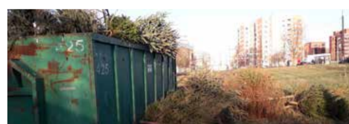
Управа напоминает, что в контейнеры нельзя класть полиэтилен и елочные украшения.

ся там до 23 января. Кампания по сбору завершится огненным шоу и разжиганием костра из елок 25 января на территории между Летной га-