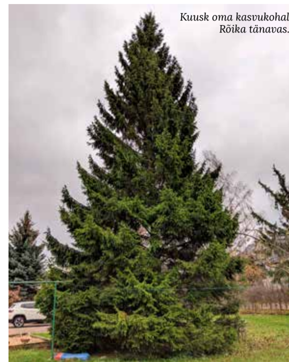
Kuusk oma kasvukohal Rõika tänavas.

Minu soov on, et kuuseke ei läheks pärast tulerooks, vaid et selle tüvest saaks teha mõne mööbliese – laua või tooli – või mõned väikesed esemed.“