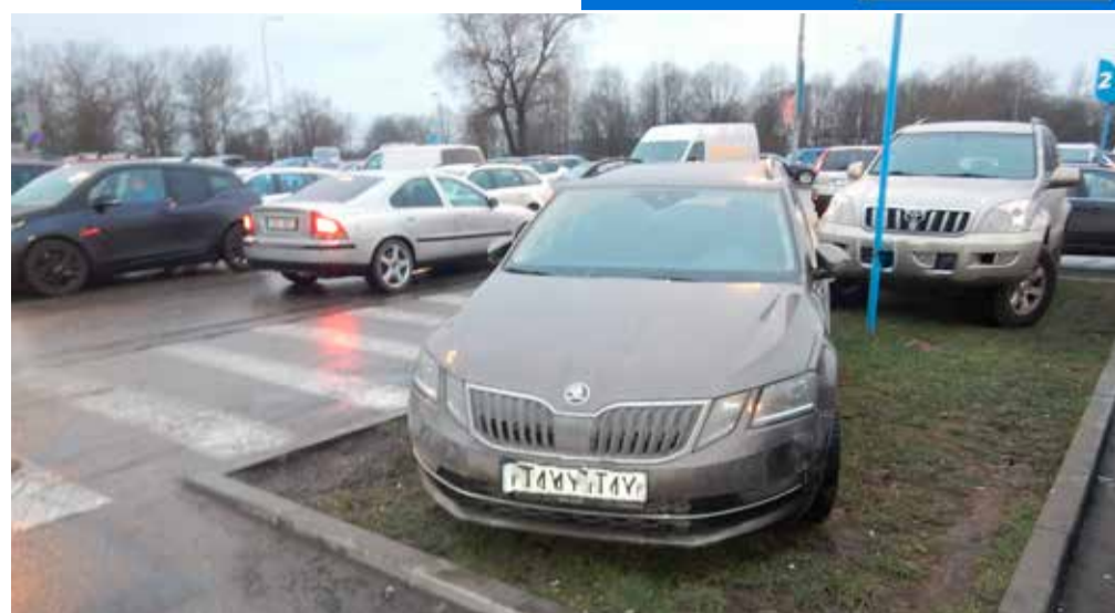
Näide tüüpilise parkimishuligaani käitumisest.

Kas rikkumiste hulk näitab ajas langus- või tõusutrendi? Rikkumiste hulk on aastate lõikes enam-vähem sama, aga trahvimine on tunduvalt vähenenud.