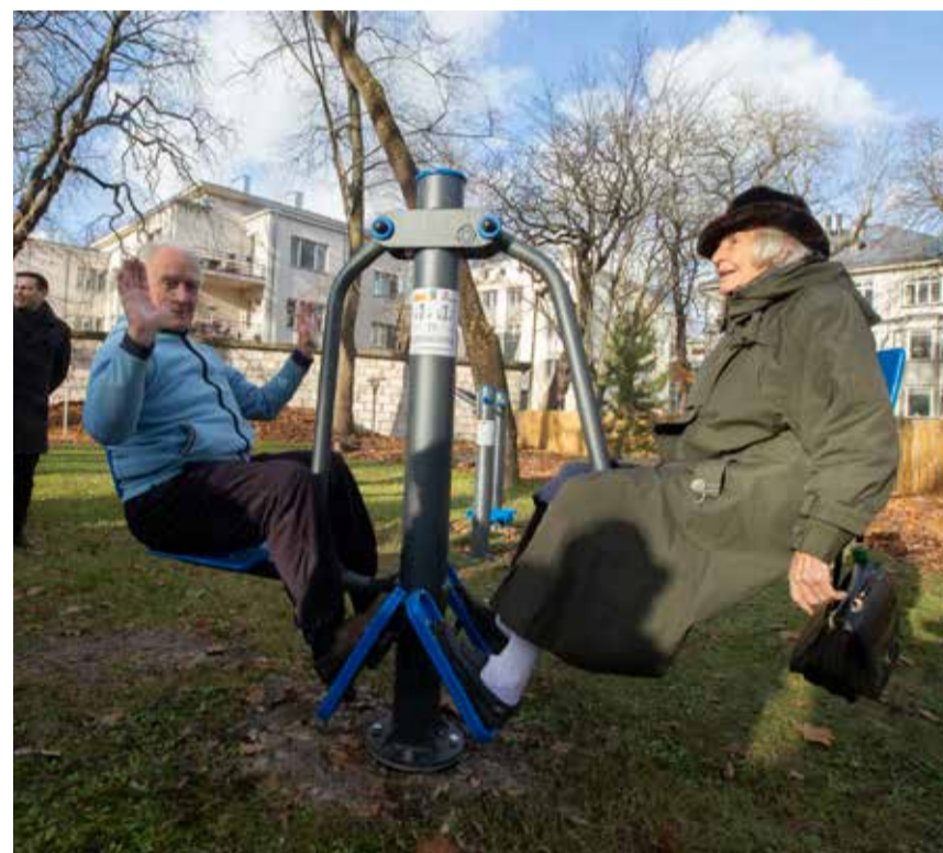
Esimesed katsetajad uutel treeninguseadmetel läinud sügisel.