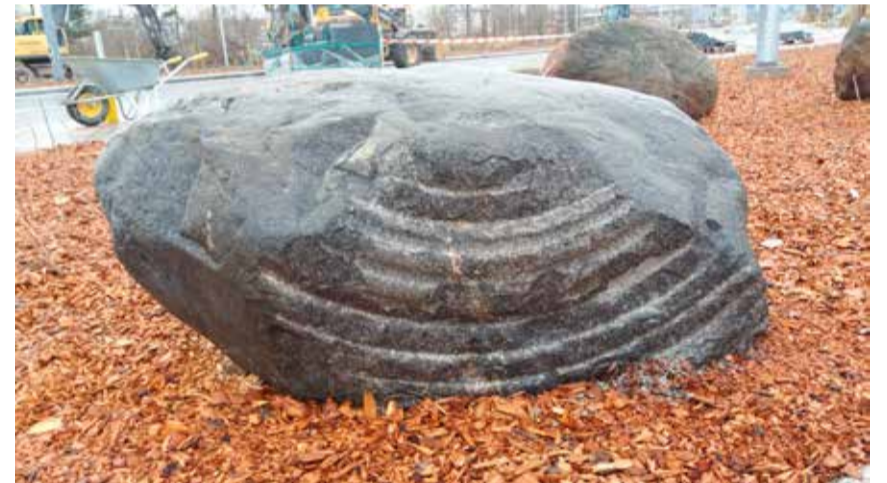
Kivi, millele paigaldatakse Reidi tee avamisel linnapeale üle antud mälestusplaat.

vraki asukoha ekslikult Reidi teega (Õhtuleht 26.10, Pealinn 25.11). Vraki