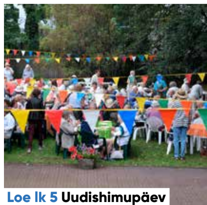
Loe lk 5 Uudishimupäev