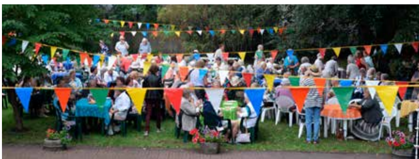
Aiapidu eelmise aasta 30. augustil.

Jaanuari viimasel kolmapäeval kella 10–18 ootab pererahvas kõiki huvilisi päevakeskuse. Kuna siin käiakse tavapäraselt vahetusjalatsites, siis on palve võtta need kaasa. Huvilistele näidatakse kogu maja, räägitakse kaasalöömise võimalustest, külastatakse huviringe, pakutakse oma tehtud joogi- ja söögipoolist. Kell 14 annab ühingu naisansambel Nostalgia meeleoluka kontserdi. Võimalik on vestelda ühingu eakamate liikmetega