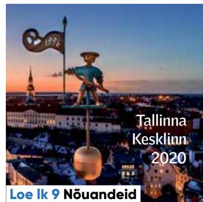
Loe lk 9 Nõuandeid

Kesklinna Sõnumite järgmine number ilmub 19. veebruaril.