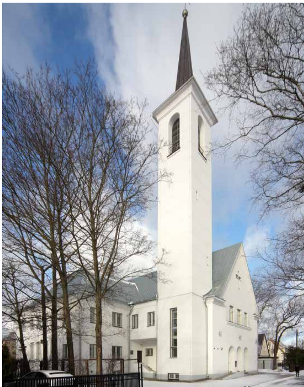
Peeteli kirik.