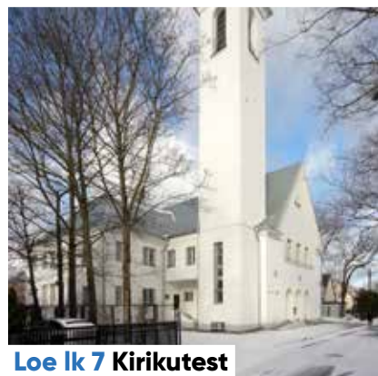
Loe lk 7 Kirikutest