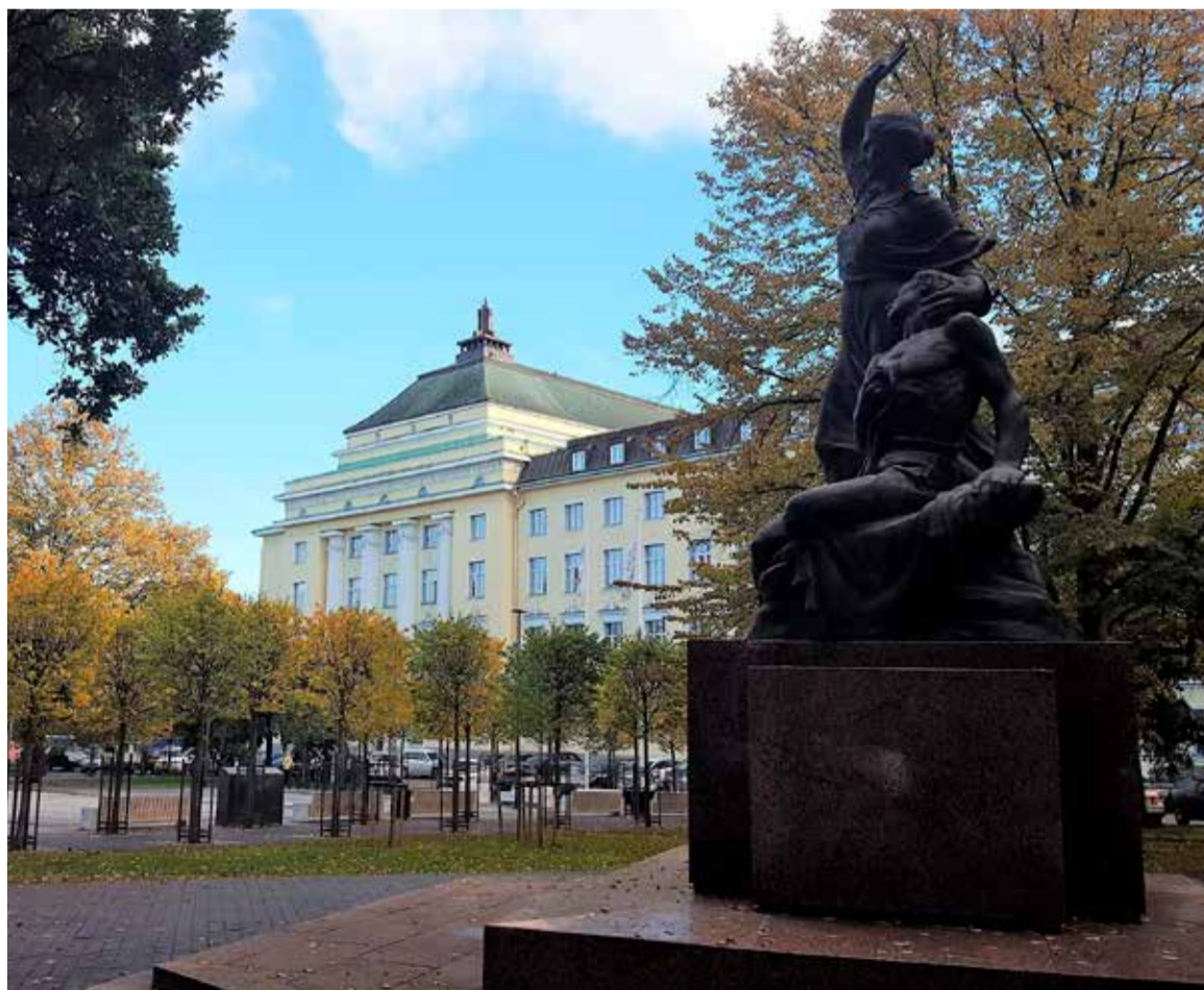
Mälestusmärk Konstantin Pätsile tuleb Uuele turule 1905. aasta revolutsiooni mälestuseks püstitatud monumendi naabrusesse.

Linnvalitsus kinnitas ka Jaan Krossi mälestusmärgile kaks alternatiivset asukohta: Kullassepa ja Harju tänava nurk ning Kullassepa tänava Raekoja platsi poolne ots. Lõplik asukoht selgitatakse välja ideekonkursi käigus.