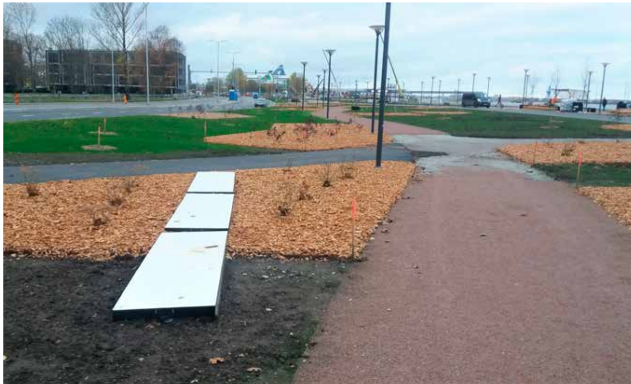
Kolmikkestest meeter mere poole oli kuni 2018. aastani veeäärne tugimüür.

Tee avamisel andis projektijuht linnapeale üle mälestusplaadi ehitamise aega meenutava kirjega. Plaati on kavas paigaldada kivile, mis on Reidi tee ja Pikksilma tänava ristmiku kõrval, sadama juurdepääsuteest kesklinna poole. Kivil on puurimisjäljed, sest see võeti välja sügavalt maa seest, kui jäi ette 1,6-meetrise läbimõõduga sajuveekollektori torude