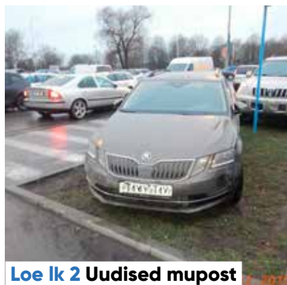
Loe lk 2 Uudised mupost

Allikas: rahvastikuregister, 1. jaanuar 2020