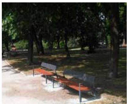
Смотрите стр. 3 Город станет зеленее