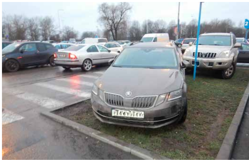
Пример типичного поведения парковочного хулигана.

Число нарушений со временем растет или снижается?