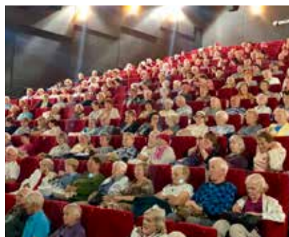
Смотрите стр. 4 В киноклубе