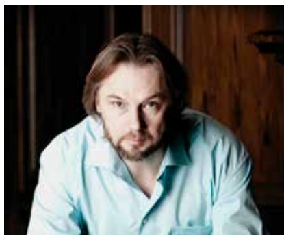
Смотрите стр. 4 В Русском музее

Следующий номер Kesklinna Sõnumid выйдет 19 февраля.