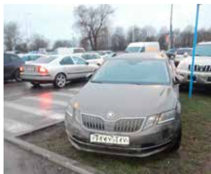
Смотрите стр. 2 Новости МуПо