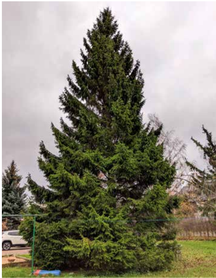
На фото ель в месте своего произрастания на ул. Рыйка.

Управа Кесклинна объявляет конкурс, чтобы получить идеи для рационального использования рождественской ели с Ратушной площади.