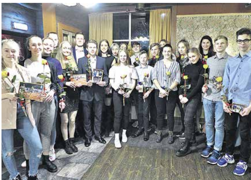
Nõmme kergejõustikuklubi 2019. aasta parimad sportlased, kes on ühtlasi kõik Eesti meistrivõistluste medalioanikud.