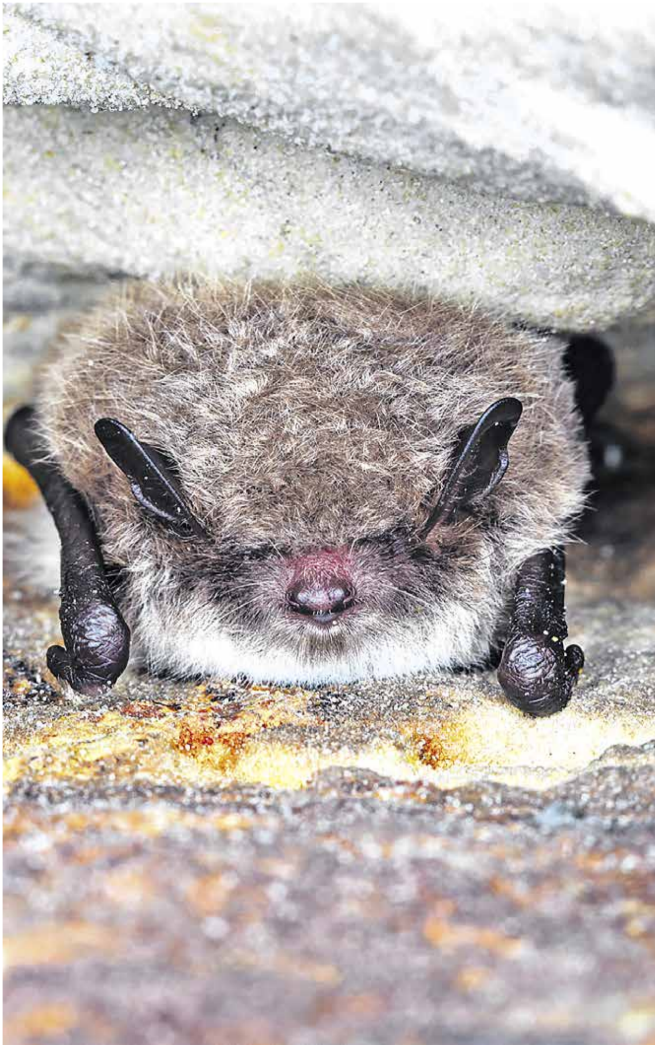
2020. aasta loomaks on kuulutatud nahkhiir.

Kuidas kindlaks teha, kas kodu lähedal on nahkhiirte koloonia? Kui näete tegutsemas korruga juba mitut nahkhiirt, siis on kindlasti soovitatav sellest nahkhiireuurijatele teada anda. Ekspertidega saab kontakti nii Eestimaa Looduse Fondi, Facebooki nahkhiiresõprade grupi kui ka keskkonnaameti või e-posti nahkhiir@el-fond.ee kaudu. (ELF)