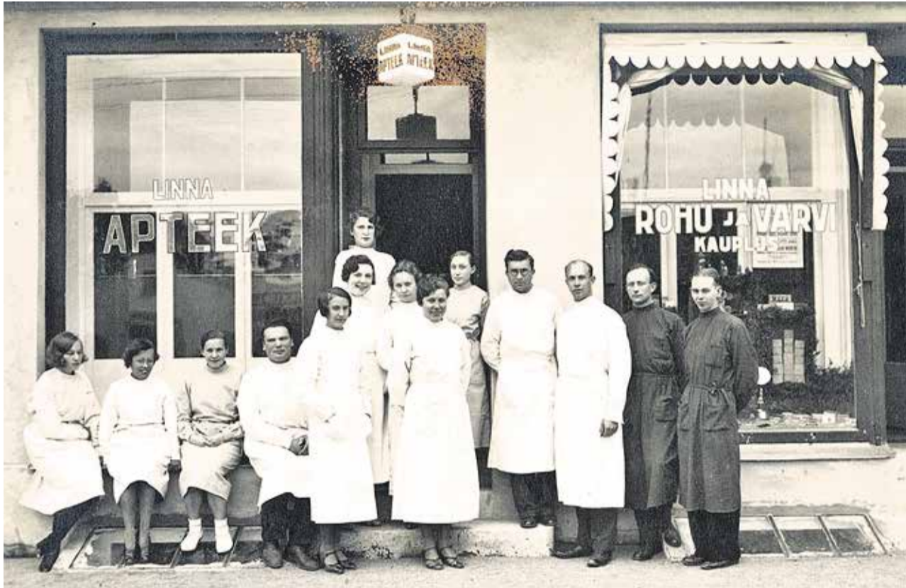
Nõmme linnaapteegi personal 1933 oma uue maja ees.

Pärast Nõmme linnaks saamist 1926. aastal tekkis vajadus asutada ka linnaapteek. Elanikkond oli võrreldes 1910. aastaga mitmekordistu-