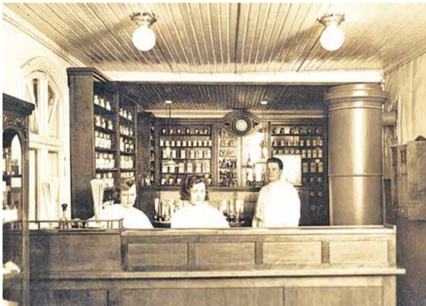
Nõmme linnaapteegi sisevaade 1930. aastal.

nud ning üks apteek ei suutnud enam kasvavaid vajadusi rahuldada.