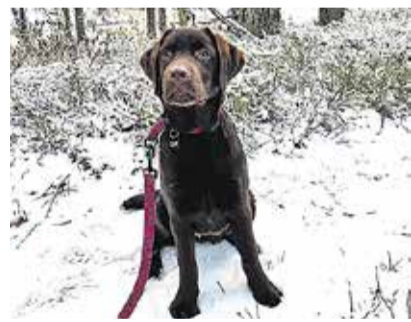
Browni on õnnelik koer, tal on soe ja turvaline kodu olemas.

Uue kodu leidis 455 kassi, 56 koera, kaks hamstrit, kuus küülikut, kaks merisiga, üks papagoi, kolm rottit ja kaks tuvi. Oma vana omaniku juurde leidis tagasitee 318 looma, neist 201 koera, 113 kassi, kaks küülikut, üks tuhkur ja üks kana. Ühtekokku püü-