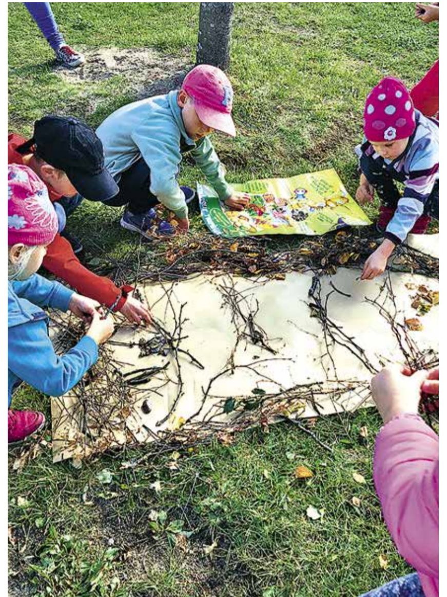
Программа Зелёная школа в Таллинском детском саду Меэлеспеа

«Зелёная школа» включает в себя 12 тем: школьный двор, море и побережье, вода, мусор, здоровье и благополучие, глобальная гражданская активность, богатство жизни и природа, транспорт, энергия, пища, отходы и климатические изменения. Каждый год образовательное учреждение выбирает три основные темы, на которые в учебном году делают акцент. Цель достигается общими усилиями – вместе над ней работают дети, родители, учителя, и другие работники учреждения.