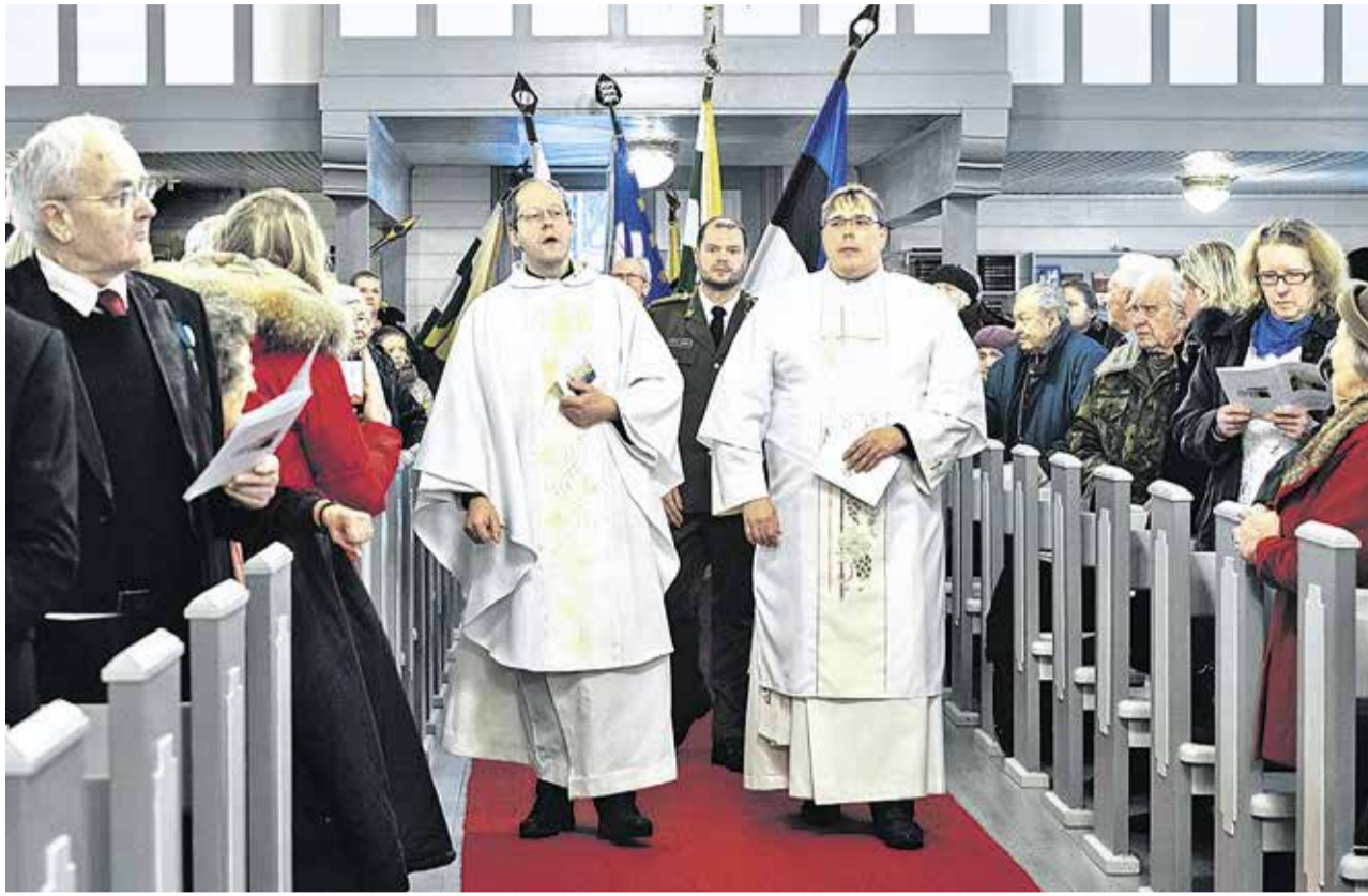
2. veebruaril toimus Nõmme Rahu kirikus Tartu rahulepingu 100. aastapäevale pühendatud mälestusteenistus.

«Tänane päev on kõige tähtsam Eestile tema ajaloos 700 aasta kestel, täna