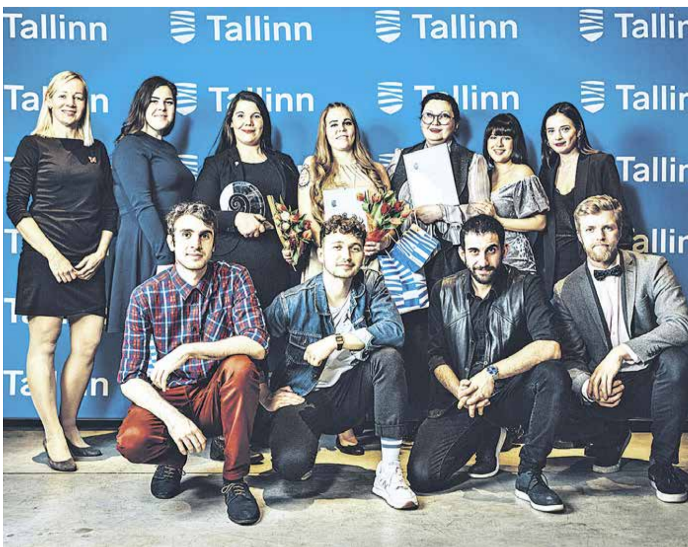
Nõmme vaba aja keskuse noortega tegelevad töötajad on linna parimad.

Nõmme tulevik on kindlates kätes. Palju õnne kõigile Nõmme noorsootöö tegijatele! (NS)