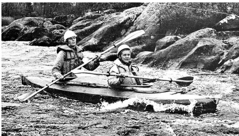
Ikka looduses - 1982. aastal Karjalas süstamatkal.

Lada ütleb, et koeri on tema elus olnud kümneid ja kõik nad vääriskid eraldi raamatut.