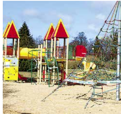
Linnaosa valitsus on sulgenud kõik Haabersti avalikud spordi- ja mänguväljakud

Head lapsevanemad! Palun selgitage oma lastele, et praegusel ajal ei ole kogunemised lubatud. Vaid reeglitest kinni hoides saavad lapsed võimalikult kiiresti taas mänguväljakutest rõõmu tunda. Palume ka kõikidel kodanikel julgelt meile teada anda, kui mänguväljakutel on lõhutud sildid või seda piiravad lindid või kui on kohti, mis vajavad erilist tähelepanu linnaosa valitsuse poolt. Soovitan tungivalt sulgeda ka ühistu-