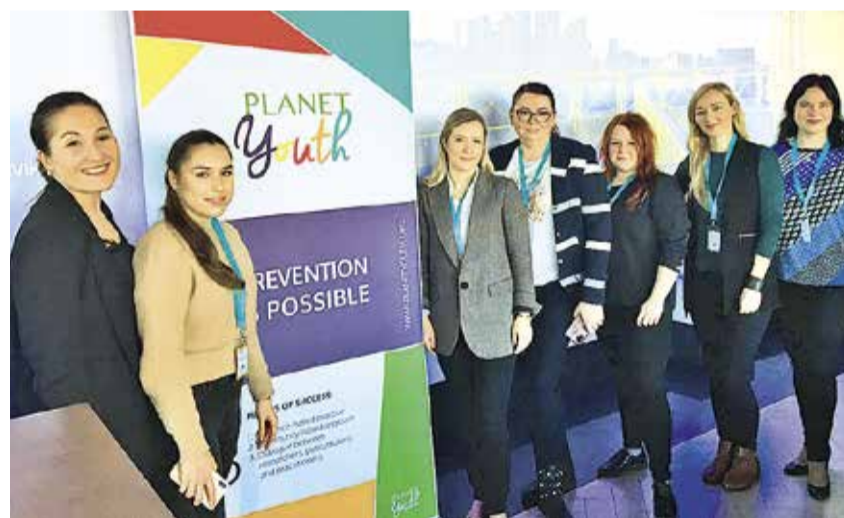
Osalejad Eestist, loo autor on paremalt neljas.

1998. aastal, kui uuringute kohaselt olid üle 60% alaealistest proovinud alkoholi, tekkis ühiskonnas vajadus ja soov paradigma muutuse järele. Leiti, et muutustega tuleb alustada viivitamatult! See oligi hetk, kui loodi Islandi mudel ehk Planet Youth programm, mis keskendub noortele turvalise keskkonna loomisele, kaasates lapsevanemaid, haridusasutusi, kohalikke omavalitsusi ja valitsust, et ühise koostöö tulemusena luua lastele keskkond, kus kõikvõimalike mõnuainete tarvitamise algus lükkuks edasi nii palju, kui võimalik. Laps peaks olema laps nii kaua kui võimalik ning vanemad ja kogukond tervikuna on selle eest vastutav.