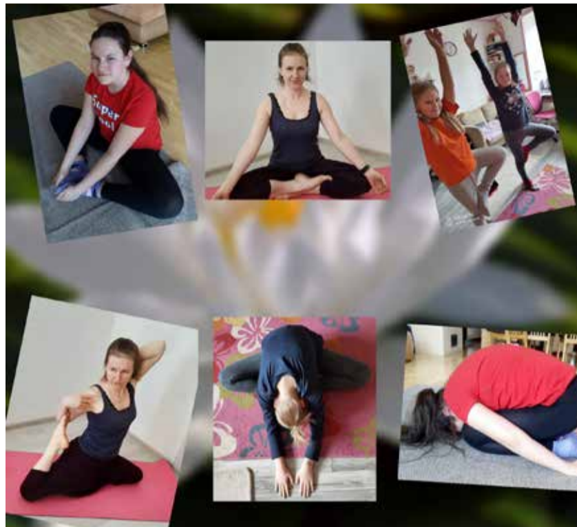
Дистанционный урок йоги в гимназии Мустьё.

Таллиннская гимназия Мустьё благодарит за поддержку управу Хааберсти, департаменты образования и здравоохранения, наших родителей и учеников.