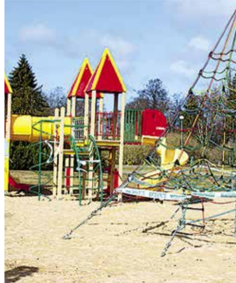
Управа закрыла все детские и спортивные площадки Хааберсти.

Дорогие родители! Пожалуйста, объясните своим детям, что в нынешнее время не разрешено собираться в компании. Только придерживаясь этих пра-