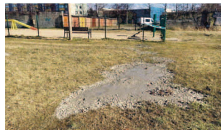
Возле площадки для выгула собак на ул. Эхте кто-то вылил бетон. У управа Пыхья-Таллинна

Услугу начнут оказывать с понедельника, 23 марта. ■