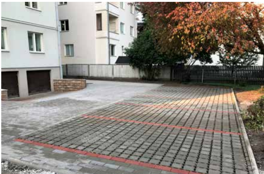
... Jaan Poska 10 aga sillutatud parkimisala.