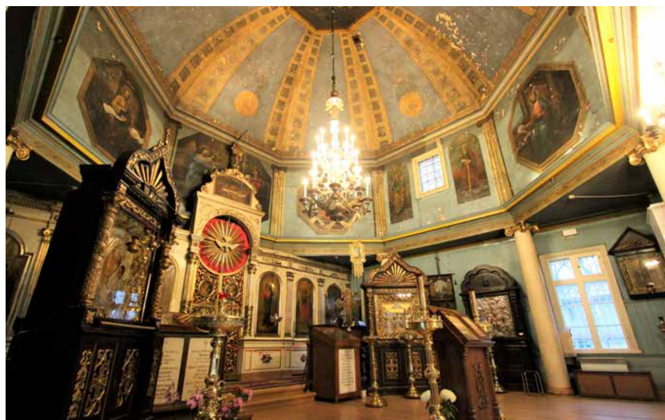
... ning selle kuppel ja nelitis enne restaureerimist 2016. aastal.