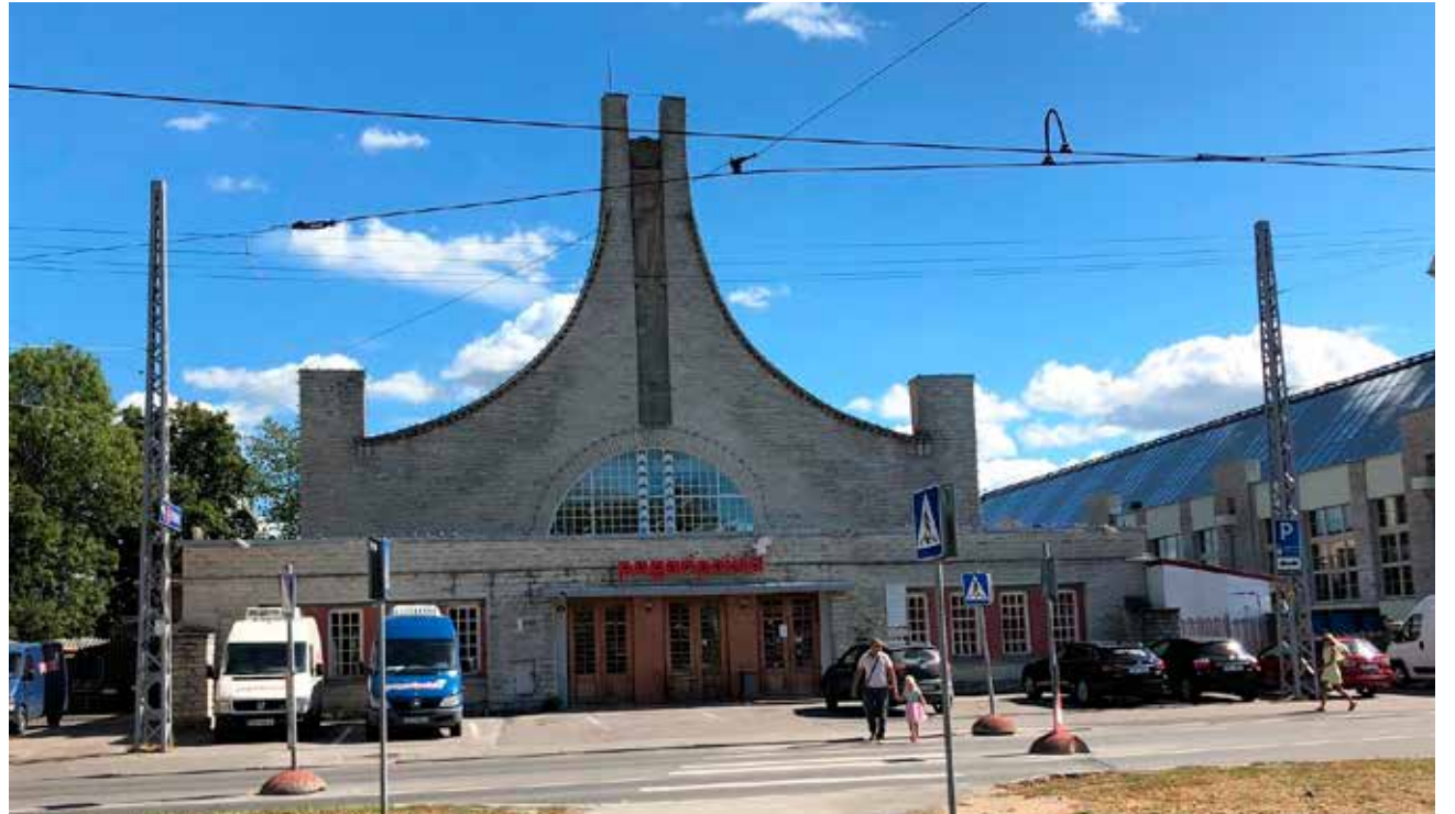
OÜ Pagari poisid

Otsime reserve ka oma töökorralduses, et pakkuda klientidele paindlikumat teenindust: hommikused tellimused täidame veel samal päeval, 25 eurost alates toimetame ostu kohale. Kuna oleme juba kaua turul olnud ja töötame suuresti tellimuste põhjal, siis oskame koguseid enam-vähem