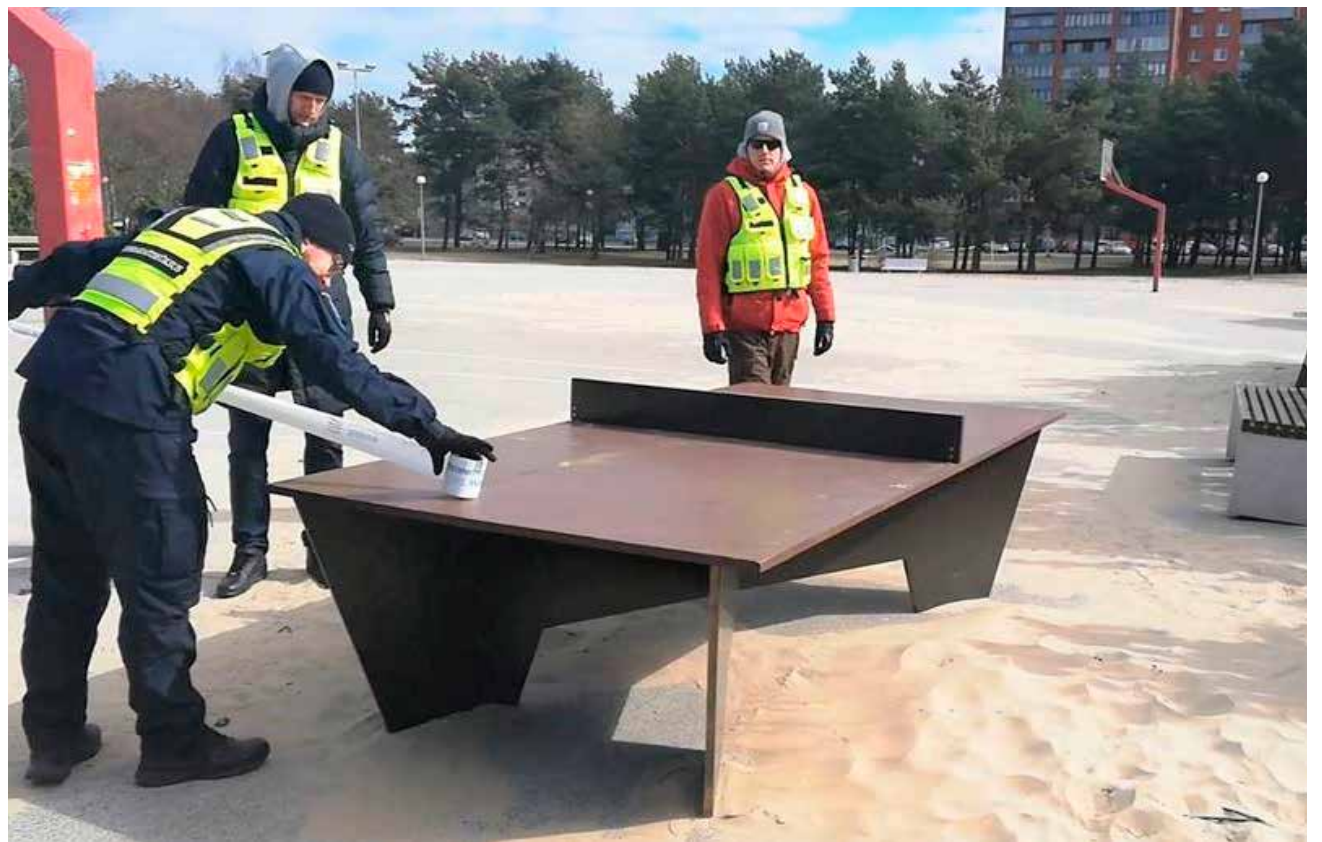
Noorsportlased aitavad mupo patrulle.

Tallinna linnajuhtide töötasu määr indekseeritakse iga kalendriaasta 1. aprilliks indeksiga kõrgemate riigiteenijate ametipalkade seaduse kohaselt. Indekseerimine puudutab linnavolikogu esimehele ja asesimehele ning linnavalitsuse liikmetele makstava töötasu või hüvitise suurust.