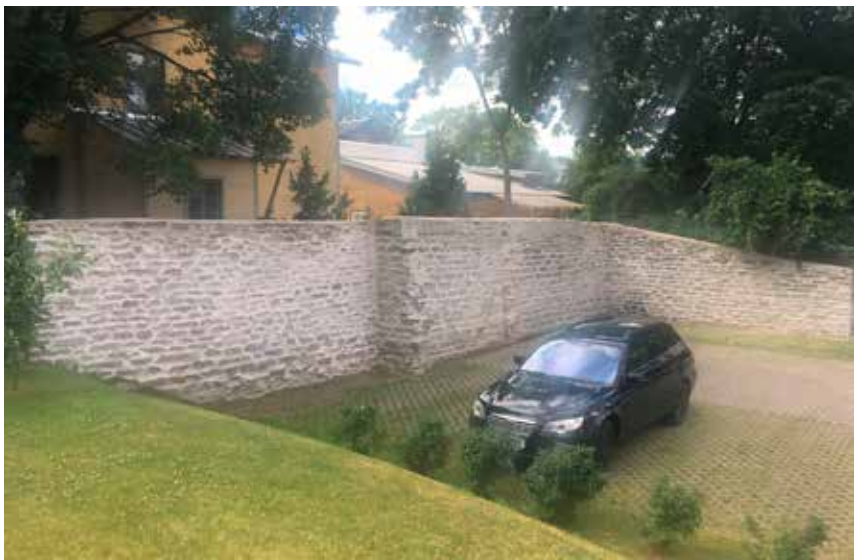
Amandus Adamsoni 27 on projekti raames saanud toreda paekivimüüri ...

Linn toetab korteriühistute hoovide korrastamist juba 14 aastat järjest, et korrastada elukeskkonda, muuta see funktsionaalsemaks ja atraktiivsemaks. Alates 2019. aastast saab taotlusi esitada elektrooniliselt tegevustoetuste registri (TTR) kaudu, mis on vähendanud olulisel määral esitatavate dokumentide mahtu.