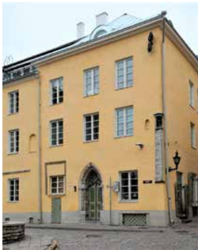
Hoonel Rüütli 2 restaureeriti 2018. aastal välisukse ja 2019 sai toetust fassaadi taastamiseks.