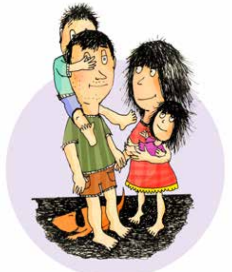
Illustratsioon: Marko Pikkat

5. Leidke iga päev endale aega. See eeldab head vanematevahelist koostööd. Üksikvanema puhul võib abi olla ka 5–10-minutilise pausi planeerimisest. Oluline on teha vahet tööaja ja isikliku aja vahel, mõlemad