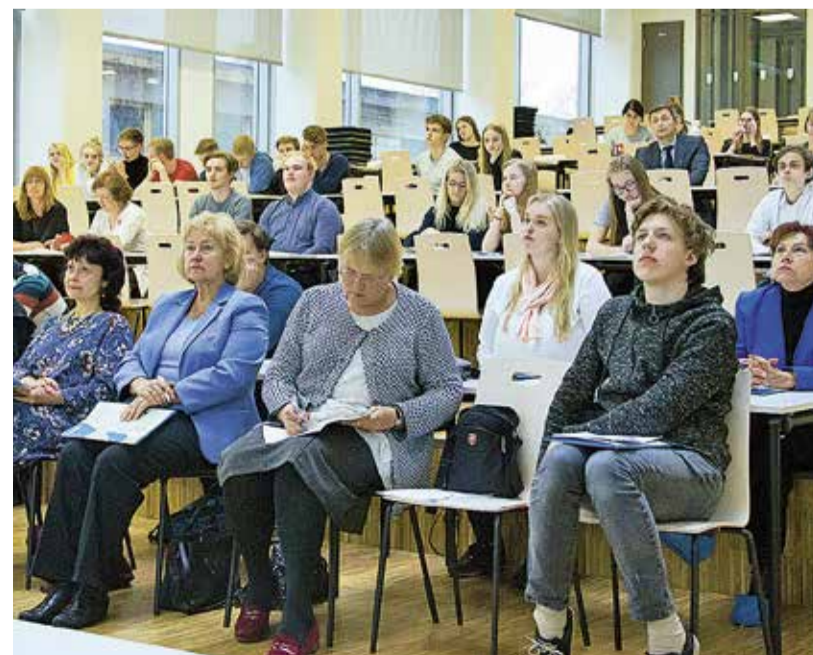
Прошгодний диктант в рамках Дня Таллинна.

Коммуникационный отдел таллиннской канцелярии