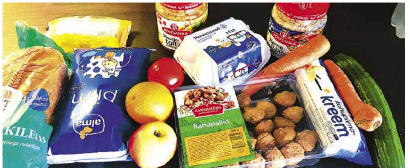
Продуктовый набор таллиннского школьника-