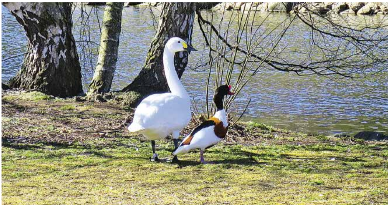
Лебедь и селезень.

Раньше всех этой весной в зоопарке родился теленок у милу по кличке Бланка, а чуть позже и у берберской полосатой мыши родились три мышонка, которые нужда-