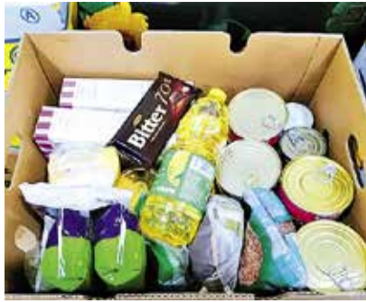
Содержимое продуктового пакета в ЕС.

Раньше жителям Хааберсти для получения пакета нужно было ехать в Ласнамяэ, в условиях чрезвычайного положения управа старается уменьшить передвижение людей и помощь можно было забрать в сво-