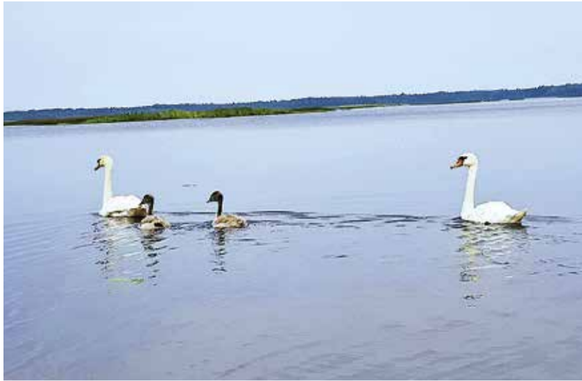
Лебеди с птенцами.

Вред птице может быть нанесён столь значительный, что поставит под угрозу её выживание в природных условиях. Кормление взрослых птиц также повышает