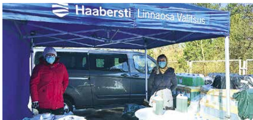
Квартирным товариществам раздали чистящие средства. Всего управа раздала 3000 литров концентрированного чистящего средства.

По оценке специалистов, влажная уборка является самым эффективным способом очистить контактные поверхности от вируса, будь то перила, кнопки лифта или почтовые ящики. Управа Хааберсти раздала всем выразившим желание квартирным товариществам райо-