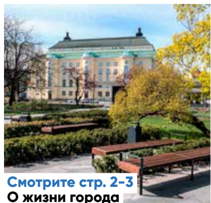
Смотрите стр. 2-3 О жизни города