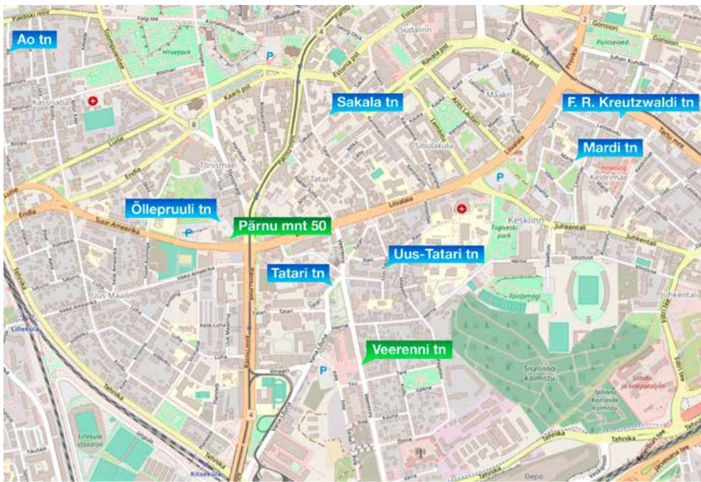
На карте синим обозначены улицы, где пройдет восстановительный ремонт проезжей части и тротуаров, зеленый цвет обозначает ремонт тротуара.

Помимо прочего, во время дистанционного обучения в таллиннских школах ученикам продолжают выдавать раз в неделю продуктовые наборы, организуя раздачу с соблюдением правил защиты от вируса. Последние пакеты будут выданы 3 июня. На протяжении последних двух недель число школьников, получающих продуктовые наборы, сохранялось на уровне 20 000 учеников.