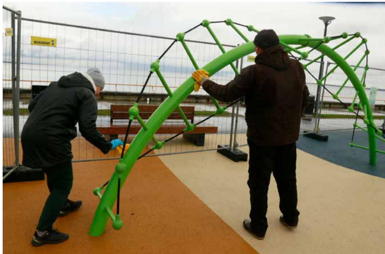
Чистить пришлось и новые игровые площадки на Рейди тез.

После основательной чистки на прошлой неделе стали вновь открывать районные игровые и спортивные площадки. Это явилось «первой ласточкой» возвращения к привычной жизни, хотя меры безопасности следует использовать и в дальнейшем.