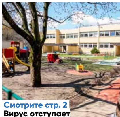
Смотрите стр. 2 Вирус отступает