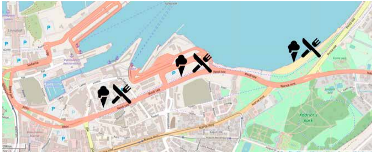
Схема с примерным расположением летних торговых точек.

«Мы хотели начать летнюю торговлю на променаде улицы Рейди в День Таллинна, 15 мая, но в связи с чрезвычайным положением начало продажи мороженого, прохладительных напитков и уличной еды, вероятнее всего, будут перенесено. Надеемся, что в будущем новый променад благодаря возможности перекусить станет еще более популярным местом у горожан», – сказала исполняющая обязанности старейшины района Кесклинн Ану Аус.