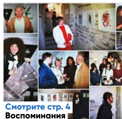
Смотрите стр. 4 Воспоминания

Следующий номер Keskklinna Sõnumid выйдет 17 июня .