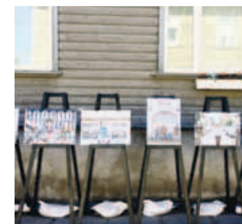
Поп-ап-выставка Бианки Соэ и Анники Метсла на улице Соо в Каламая. Районная управа Пыхья-Таллинна

По этой причине формат выставок поп-ап станет отличной возможностью проведения культурных мероприятий для жителей района. ■