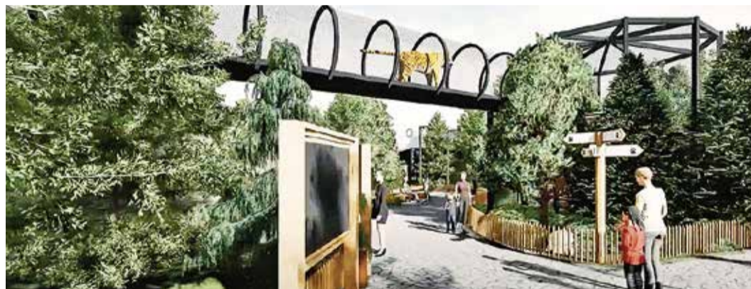
Визуализация будущей долины тигров в Таллиннском зоопарке, скриншот с YouTube.