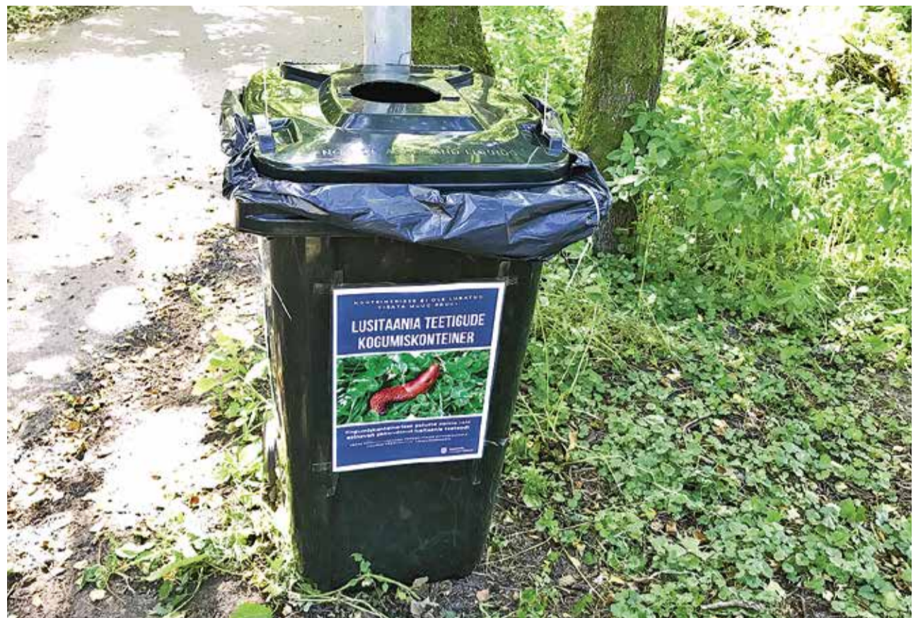
Контейнер для сбора испанских слизней.