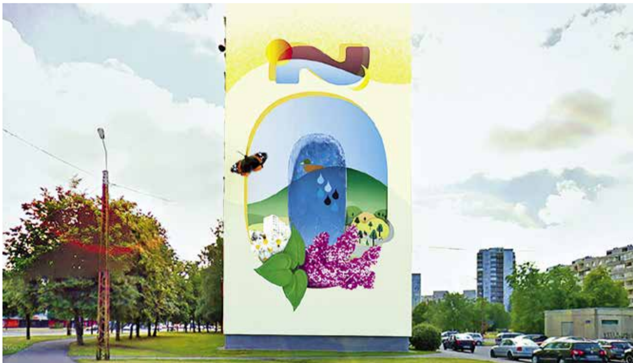
Эскиз суперграфика Õ II на стене дома по адресу Ыйсмяэ теэ, 2.

По заказу коммунального департамента и департамента окружающей среды, уже пятый год подряд в столице проходят работы по украшению фасадов многоквартирных домов суперграфическими карти-