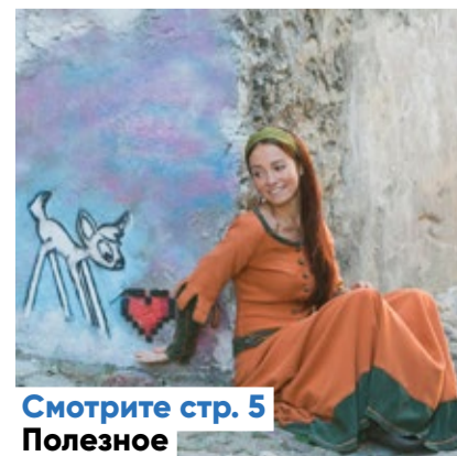
Смотрите стр. 5 Полезное

Следующий номер газеты Keskklinna Sõnumid выйдет 16 сентября.