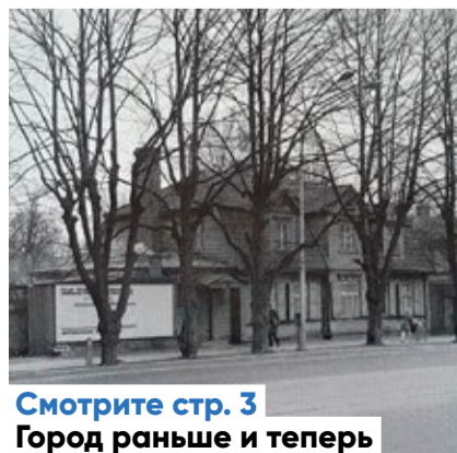
Смотрите стр. 3 Город раньше и теперь