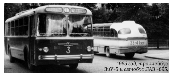
1965 год, троллейбус ЗиУ-5 и автобус ЛАЗ-695.