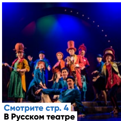
Смотрите стр. 4 В Русском театре