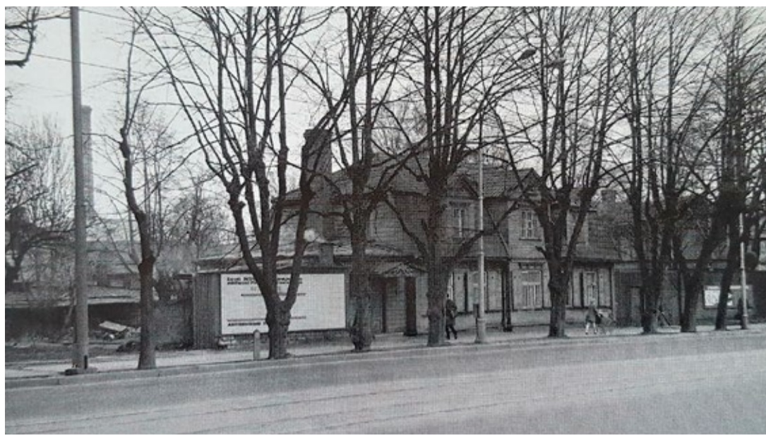
Почтамт был построен вместо деревянного здания по адресу Нарвское шоссе, 1, о котором Ааре Оландер в своей книге «Исчезнувшие виды» пишет, что на момент сделанной в 1970 году фотографии этот столетний дом еще использовался для детского сада. Старая фотография хранится в Историческом музее.