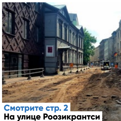
Смотрите стр. 2 На улице Роозикрантси