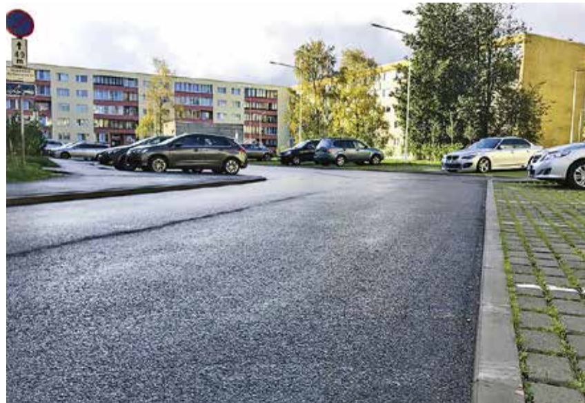
Обновлённая дорога и парковка во дворе Бийсмяз теэ 89.