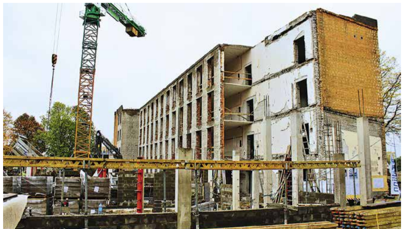
Новое здание гимназии Мустьёэ будет построено по адресу Палдиски мнт., 83.

В ходе реконструкции снесли комплекс, в котором располагались спортзал и актовзл, здесь будет построен новый, отвечающий современным требованиям учебный комплекс с оборудованной внешней территорией. Вдобавок к новому зданию школы также получат отремонтированный стадион с беговыми дорожками, футбольным полем с искусственным покрытием, а также различными аттракционами, на котором у детей бу-