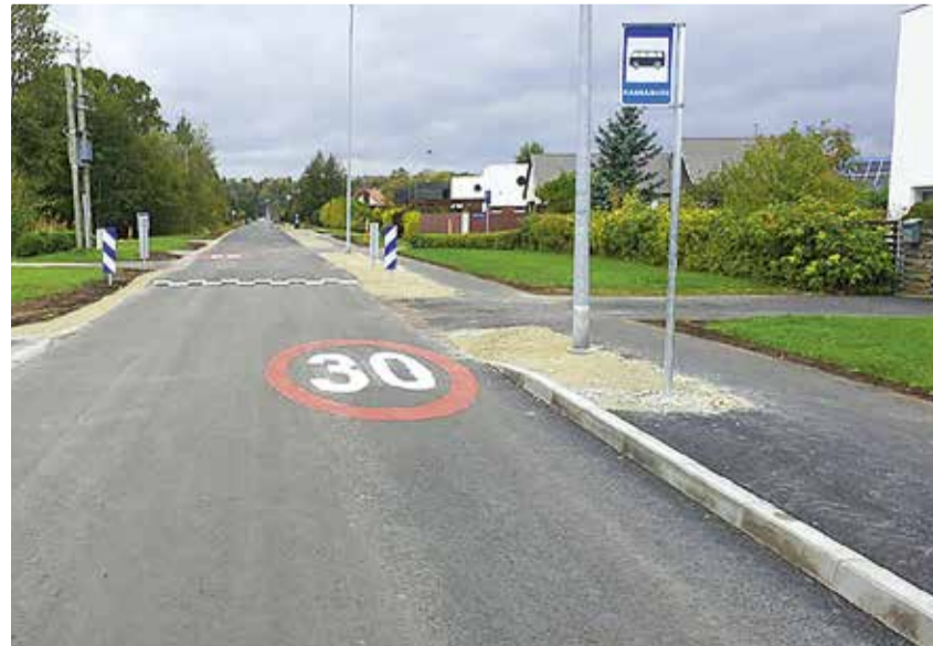
Обновлённое дорожное покрытие на улице Талудевахе.