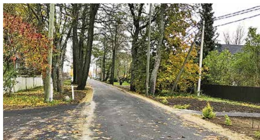
В ходе работ на Сыудэбааси теэ новое асфальтовое покрытие получил участок дороги, протяжённость более чем 500 метров.

В рамках работ построена система коммунального водоснабжения как для имеющих объектов, так и для создаваемых и в перспективе, также готовы пункты для подключения к общей системе канализации. Помимо это-