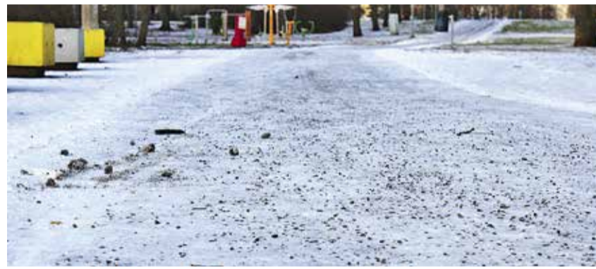
Управа раздаёт квартирным товариществам района гранитную крошку для борьбы с обледенением.