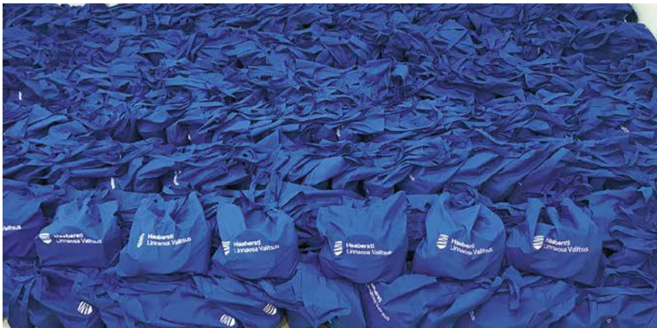
Пакеты помощи одиноким пенсионерам района.

Управа Хааберсти организует кампанию по предоставлению предметов первой необходимости и продуктовых пакетов для проживающих в районе одиноких пенсионеров по старости, ежемесячный доход которых составляет менее 582 евро.