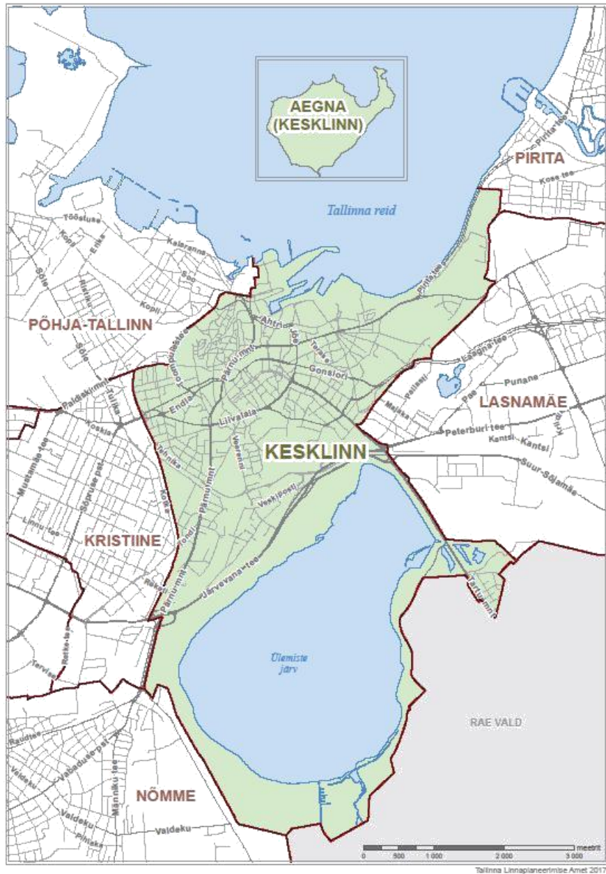
Kesklinna linnaosa skeem