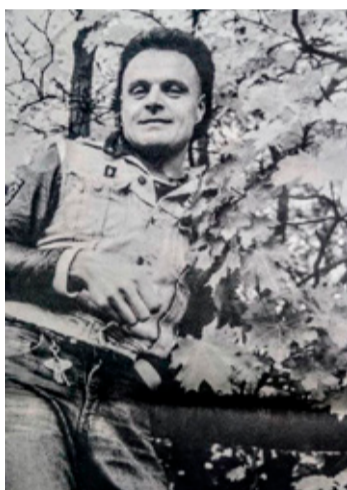
Pelle Miljoona 1985. aastal, kui esimest korda Tallinnas käis.

Bändide lauljad Villu Tamme, Tõnu Trubetsky ja Pelle Miljoona on kõik seotud punkkultuuriga. Pelle Miljoona oli Soome pungi teerajajaid juba 1970-ndate lõpust, Villu Tamme ja Tõnu Trubetsky Eestis 1980-ndatest. Sidemed Soomega on olnud alates 1980-ndate lõpust tihedad. J.M.K.E.-l oli põhjanaabrite pool hittlugu „Tere, perestroika“ ja edukad on olnud ka albumid. Vennaskond aga emigreerus 1991. aasta alguspoolel, veel mõned kuud enne Eesti taasiseseisvumist,