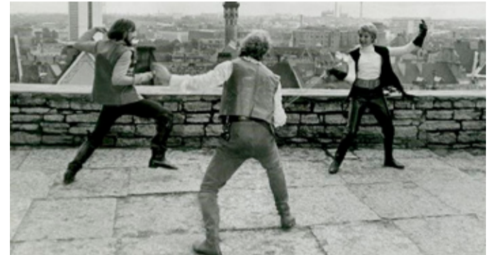
Kaader muusikalisest mängufilmist „Don Juan Tallinnas“ (1971)