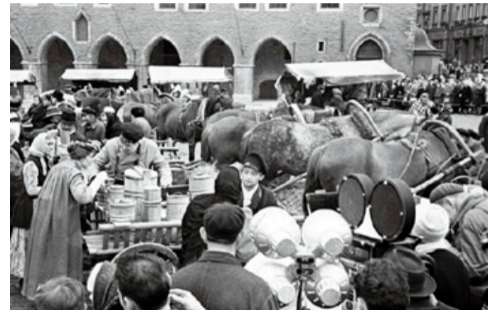
Kaader mängufilmist „Mäeküla piimamees“ (1965)