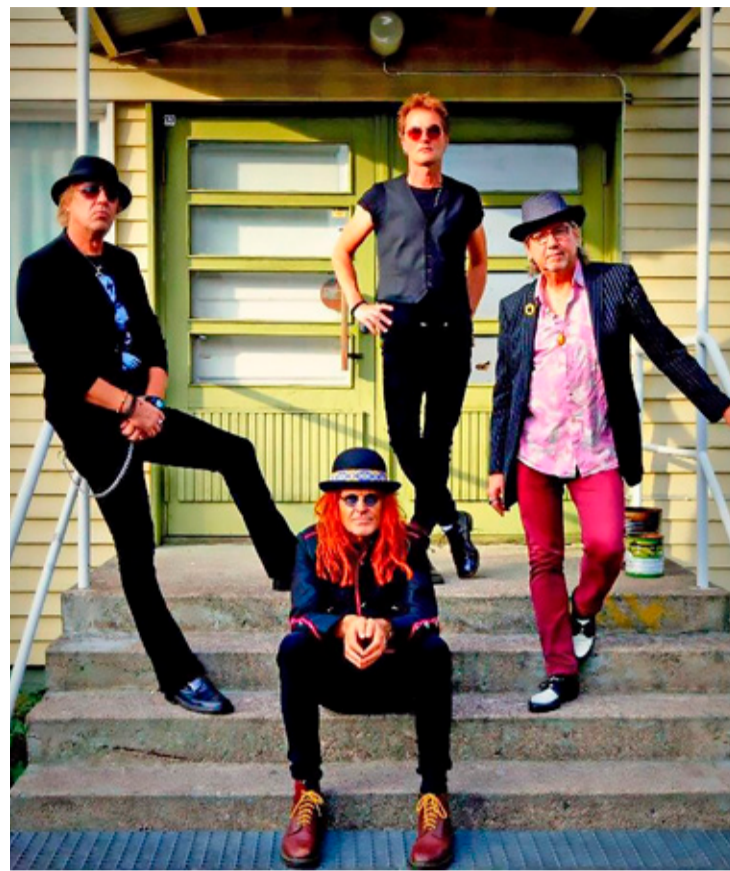
Pelle Miljoona ja Rockers.

Pelle, kes on juba nõukaajast, alates 1980-ndate keskaigast õige mitu korda Tallinnas käinud, kiidab, et linn on muutunud „moderniks euroopalikuks väikseks kosmopoliks, millel on isikupärane identiteet“. Muusik kiidab, et noored räägivad head inglise keelt ja on avatud ja sõb-