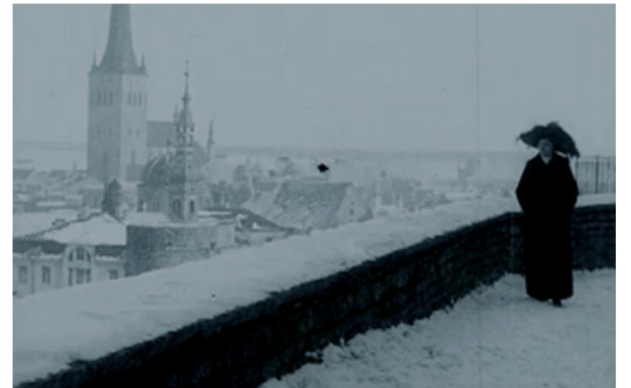
Kaader esimesest Eesti mängufilmist „Laenatud naene“ (1912)