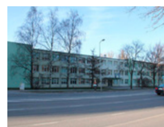
nr20 Tallinna Südalinna Kool (Liivalaia 23) 15. ja 16. oktoobril kella 12–20 17. oktoobril kella 9–20 tel 5430 1020