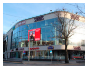
nr17 Solaris keskus (Estonia pst 9) 11.–16. oktoobril kella 12–20 17. oktoobril kella 9–20 tel 5430 1017