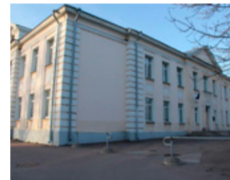
nr12 Jakob Westholmi Gümnaasiumi algklasside maja (Luise 38) 15. ja 16. oktoobril kella 12–20 17. oktoobril kella 9–20 tel 5430 1012