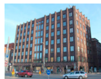
nr18 Tallinna Linnavalitsuse hoone (Vabaduse väljak 7) 15. ja 16. oktoobril kella 12–20 17. oktoobril kella 9–20 tel 5430 1018