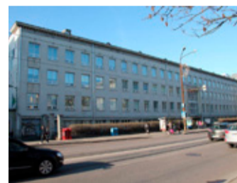
nr13 Tallinna Ülikool (Narva mnt 25) 11.–16. oktoobril kella 12–20 17. oktoobril kella 9–20 tel 5430 1013