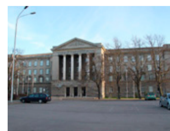
nr22 Tallinna Tehnikakõrgkool (Pärnu mnt 62/1) 11.–16. oktoobril kella 12–20 17. oktoobril kella 9–20 tel 5430 1022