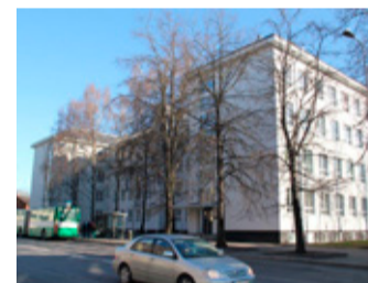
nr16 Kadrioru Saksa Gümnaasium (Gonsiori 38) 15. ja 16. oktoobril kella 12–20 17. oktoobril kella 9–20 tel 5430 1016