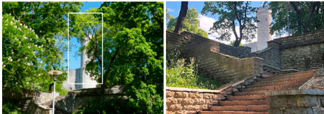
Avatud vaade Hirvepargi trepilt Pikale Hermannile.