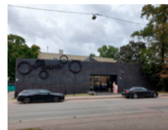
nr14 Raua Saun (Raua 23) 15. ja 16. oktoobril kella 12–20 17. oktoobril kella 9–20 tel 5430 1014