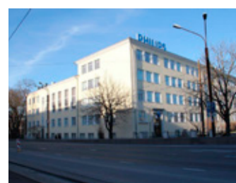
nr21 Tallinna Ühisgümnaasium (Pärnu mnt 71) 15. ja 16. oktoobril kella 12–20 17. oktoobril kella 9–20 tel 5430 1021