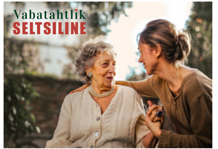
2021.–23. aastal viib Eesti Külaliikumine Kodukant sotsiaalministeeriumi tellimusel ja Euroopa Sotsiaalfondi toel ellu projekti „Vabatahtlike kaasamise koostöömudeli rakendamine hoolekandesüsteemis“.