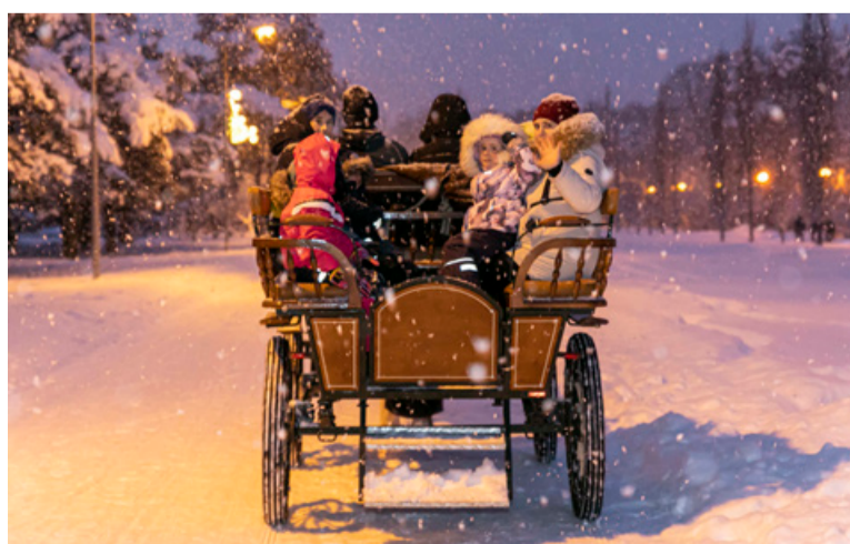
7-го января пройдет последний в сезоне Рождественский городок. Илья Матусихис

26.01 в 12:00 (на эстонском языке) и в 14:00 (на русском языке) Академия для пожилых в Общественном центре Пыхья-Таллинна (Кари, 13; нужна Covid-19 справка)