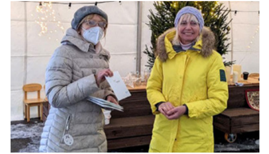
Поблагодарили примерно 130 педагогов. ВПТ

Управа Пыхья-Таллинна поблагодарила лучших работников сферы образования