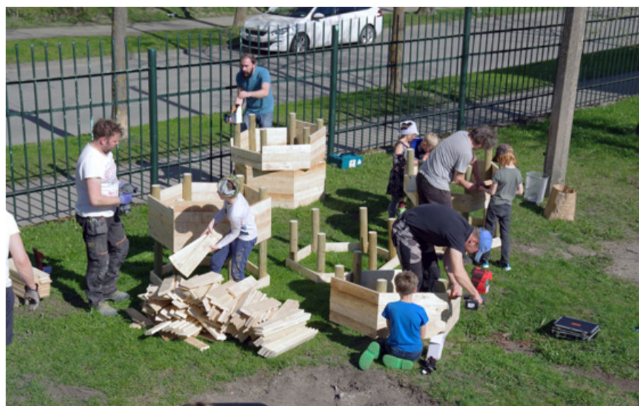
Садоводством можно заниматься в городе.

Таллиннская свободная вальдорфская школа, которая уже более 11 лет является частью сообщества Пыхья-Таллинна, в этом сезоне получила от Таллиннского департамента окружающей среды и коммунального хозяйства пособие на развитие своей дворовой территории. Благодаря пособию, теперь у нас есть сад с лечебными травами, быстрый компостер для пищевых отходов, компостный ящик для садовых отходов и большой набор инструментов. Мозговые штурмы и субботники в саду помогли найти и развить сильные стороны и объединяющие черты нашего сообщества. Мы продолжим развивать наш сад и готовимся к подаче заявок в 2022 году ( www.tallinn.ee/est/keskkond/linnaaiandus ).