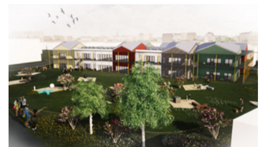
«Келлуке» будет готов осенью. Nord Projekt

Кстати, о детских садах: одним из пунктов коалиционного договора стало обещание не поднимать плату за место в детском саду для жителей Таллинна в течение ближайших четырех лет. Это важно, поскольку каждый раз эта сумма росла вместе со ставкой минимальной зарплаты по стране. Теперь город компенсирует разницу, так что плата останется на прежнем уровне. Учитывая, что цены сейчас растут практически на всё, это станет приятным исключением.