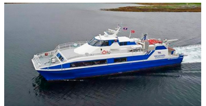
О достопримечательностях острова Аэгна можно подробнее узнать на странице Таллинна по адресу https://www.tallinn.ee/aegna/

Остров Аэгна площадью всего три квадратных километра занимает 17-е место среди островов Эстонии. В зависимости от времени года на Аэгна по-