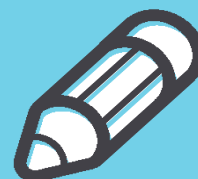
IMAGE EDITING (GIMP)