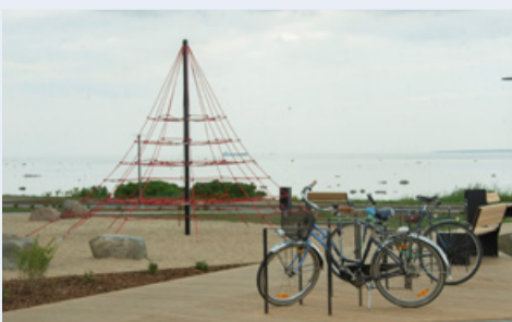
Общая планировка Пыхья-Таллинна ориентирована и на открытость к морю. Альберт Труувьяарт

Поэтому район занимает осторожную позицию в отношении строительства частных домов на улице Неэме и не согласовал его. Такие шаги могут быть предприняты только путем обсуждения различных альтернатив с местным сообществом.