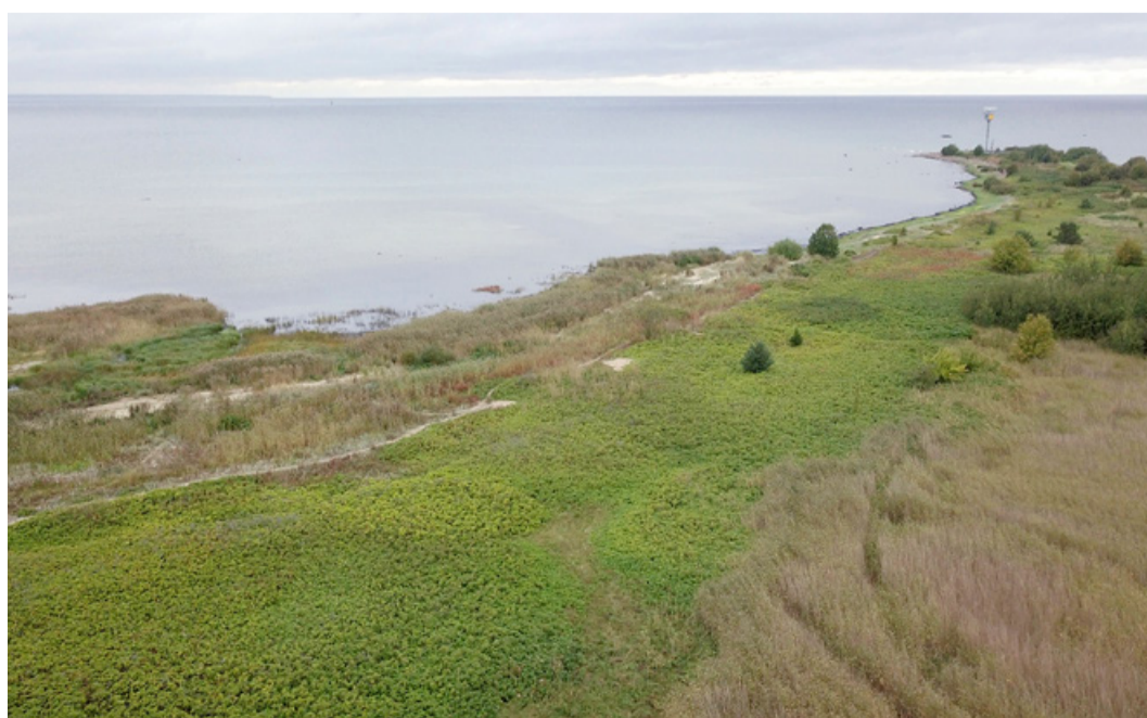
Там, где растет шиповник морщинистый, должны располагаться различные прибрежные сообщества.