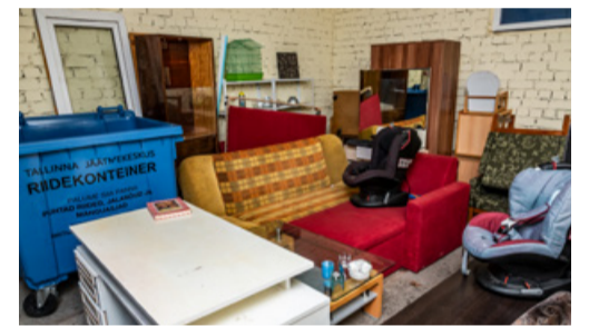
Подробнее jaatmejaam.ee, тел. 616 4000

С апреля станция приема отходов Пальяссааре (Пальяссааре, 5) открыта по будням с 12 до 20 часов, а по выходным – с 10 до 18. В государственные праздники пункт закрыт. Также Таллинн вместе с Центром повторного использования открыл на Пальяссааре пункт повторного использования, куда можно приносить ставшие ненужными вещи в хорошем состоянии.