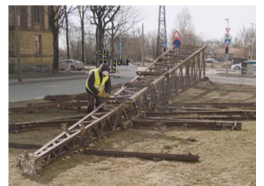
Коридор линии будет очищен от мачт к концу апреля. Elering