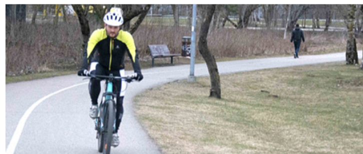
Kesklinna ja lähiumbruse rattateed 2022+

фраструктуры будет поделено на несколько этапов. Уже в этом году будет построен целый ряд велодорожек на улицах Вана-Каламая, Йыз, Пронкси и Тулика.