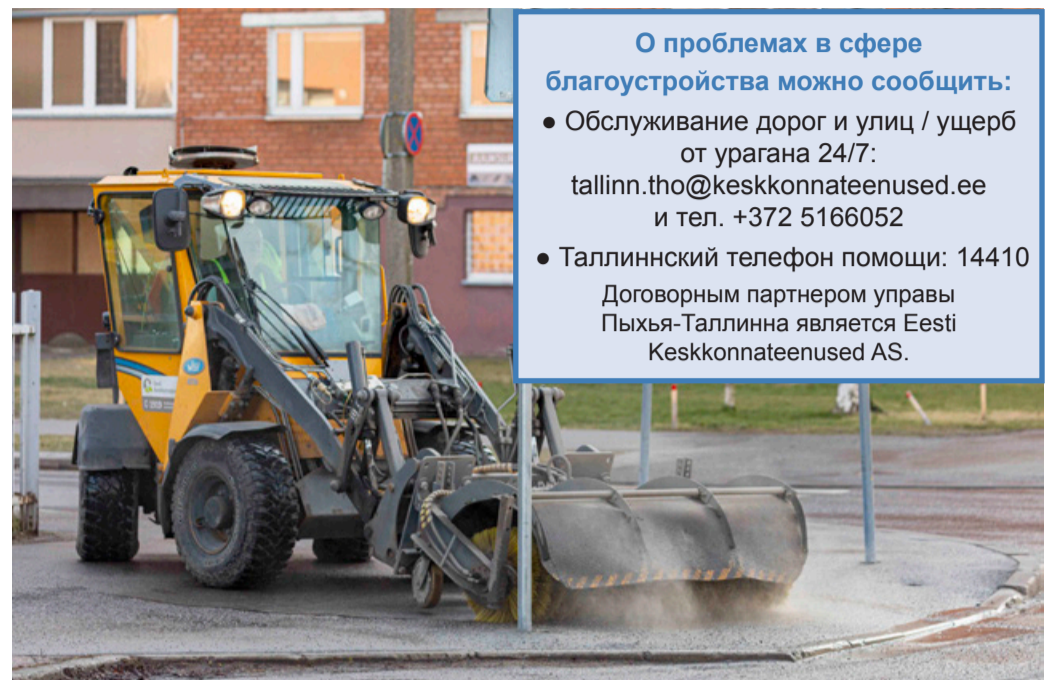
Уборка закончится к маю. Илья Матусихис

Очистим все вместе город от грязи и пыли!