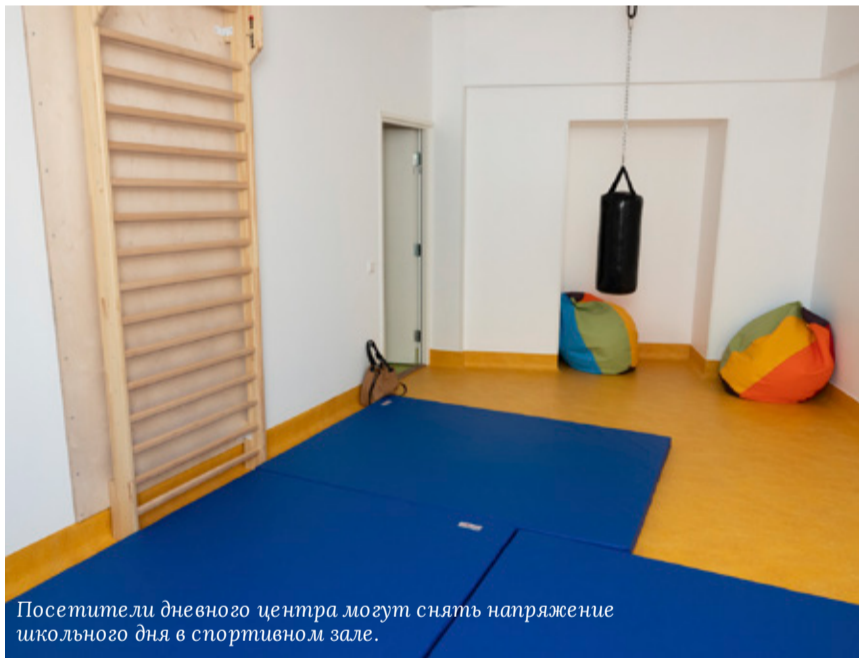
Посетители дневного центра могут снять напряжение школьного дня в спортивном зале.