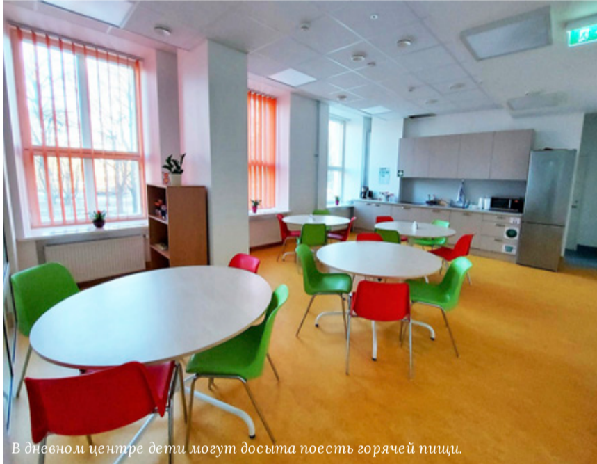
В дневном центре дети могут досыта поесть горячей пищи.