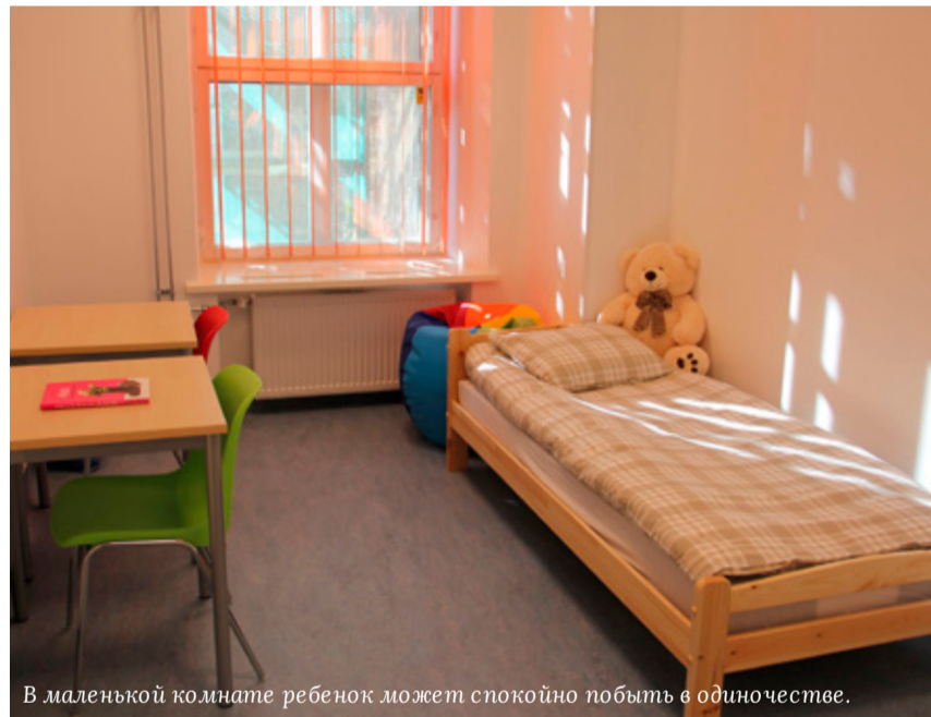
В маленькой комнате ребенок может спокойно побыть в одиночестве.