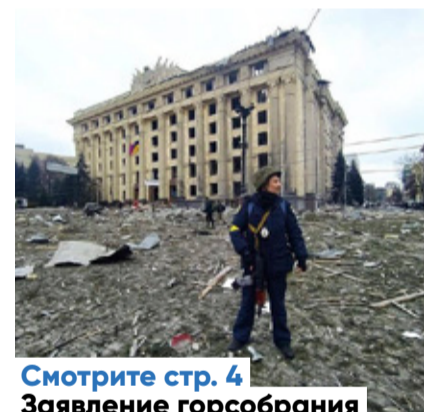
Смотрите стр. 4 Завлечение горсоборания