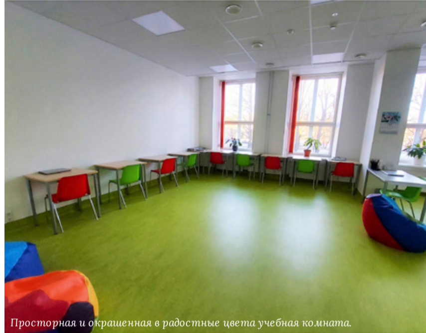
Просторная и окрашенная в радостные цвета учебная комната.