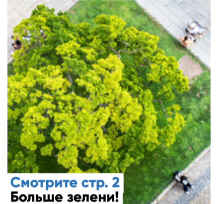
Смотрите стр. 2 Больше зелени!